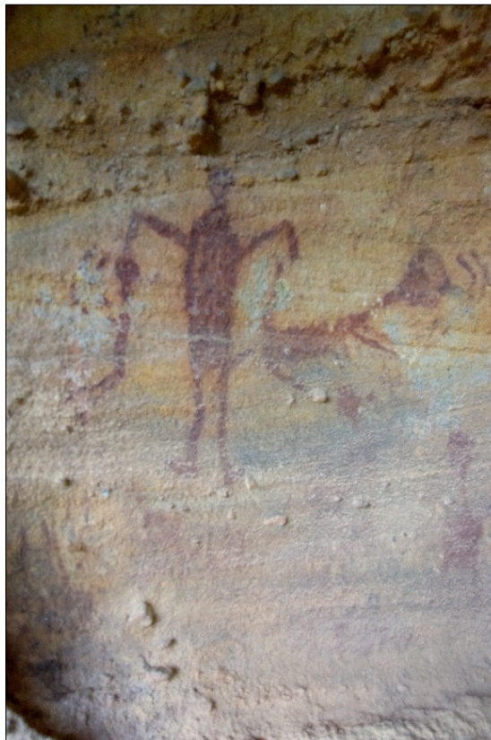
Figura 3: Prática sexual entre um antropomorfo do sexo masculino e dois antropomorfos do sexo feminino (salienta-se que a representação antropomorfa do lado esquerdo, tem dimensões menores. Seria uma adolescente e/ou criança?)