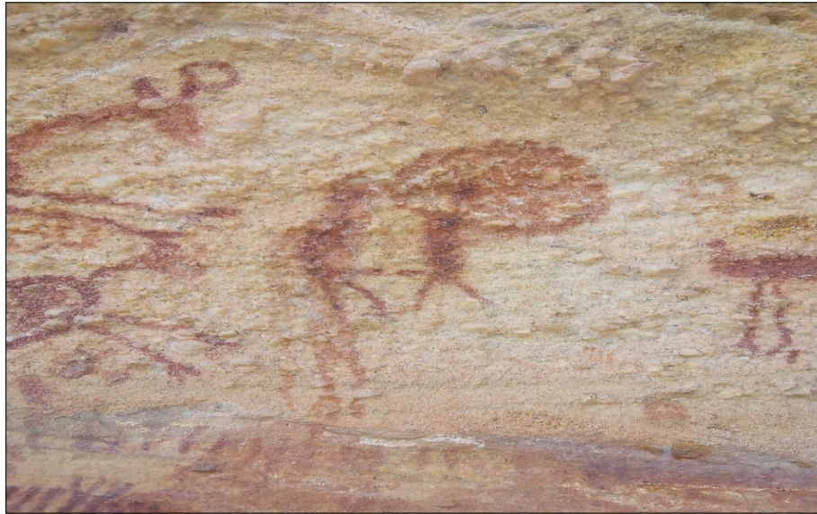
Figura 2: No centro da imagem, antropomorfos com falos eretos e de frente um para o outro.