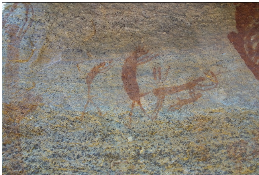
Figura 4: Prática sexual na presença de crianças.

A sexualidade é uma temática recorrente nos registros rupestres dos sítios arqueológicos do Parque Nacional Serra da Capivara, em especial os localizados no município de São Raimundo Nonato, que apresentam diversas cenas de práticas sexuais entre pessoas do mesmo sexo, sexo entre pessoas de sexos distintos, sexo de pessoas com animais, sexo grupal entre pessoas e sexo de adultos com crianças ou pelo menos na presença das crianças, como pode ser visualizado.