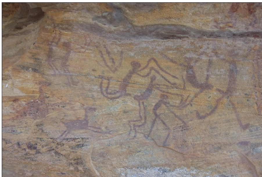
Figura 1: Prática sexual em grupo entre pessoas de sexo diferente e do mesmo sexo.

Fonte: Toca do Baixão do Perna IV. Acervo dos autores (2018).