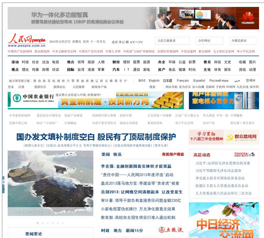
Fig.4. Capa do jornal The People's Daily em 27 de dezembro de 2013.

das águas. A coincidentia oppositorum desses dois elementos é capaz de ativar o nível arquetipológico da imagem simbólica.