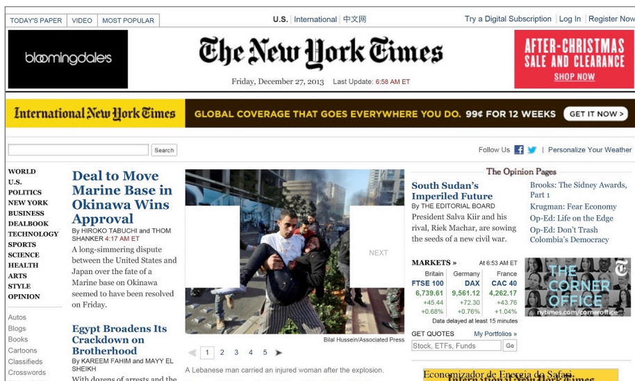
Fig. 2. Capa do jornal The New York Times em 27 de dezembro de 2013

O acontecimento diz respeito a um conflito histórico. Parte do território libanês foi ocupada militarmente pela Síria por quase três décadas e o economista morto era parte da oposição sunita libanesa ao presidente sírio xiita, Bashar al-Assad. Um dos primeiros grandes protestos no Oriente Médio na chamada Primavera Árabe, em janeiro de 2011, foi a reação dos sírios contra governo de Assad.