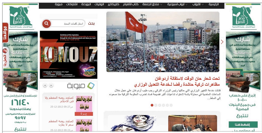
Fig. 1. Capa do jornal Al-Ahram em 27 de dezembro de 2013.

A crise na Turquia já havia provocado o pedido de renúncia por parte de três ministros. A poucos meses das eleições no país, os filhos dos ministros, aliados ao governo, foram acusados de corrupção e favorecimento político. Erdogan, no poder há dez anos, foi avaliado como autoritário pela mídia internacional devido a ações para conter os fortes protestos durante junho de 2013, que reuniram mais de dois milhões de turcos nas ruas.