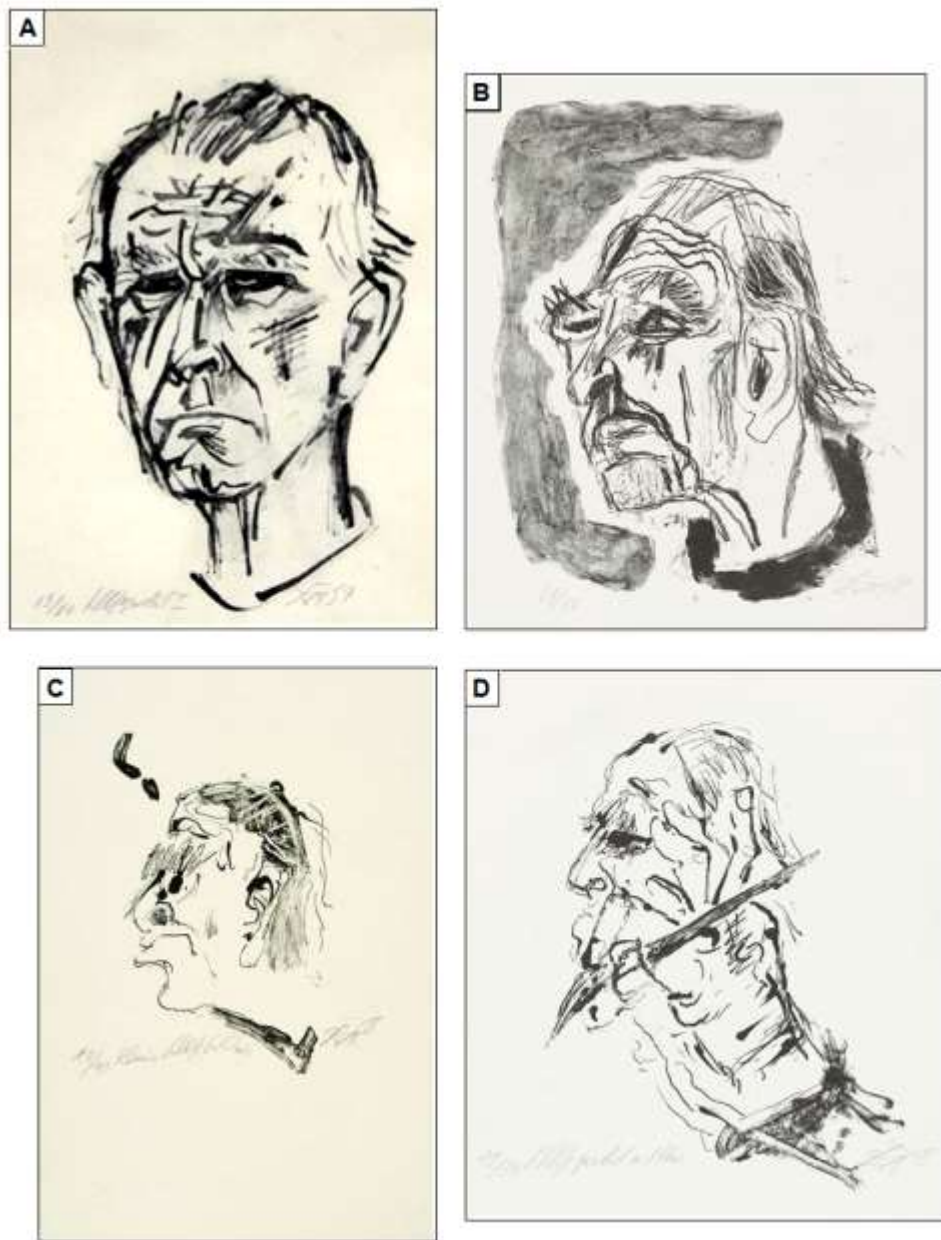
Figura 2. Autorretratos de autoria de Otto Dix. A - Produção de 1957, 10 anos antes do primeiro episódio de AVE; B, C e D - Sequência de litografias produzidas no ano de 1968, cerca de um ano após o AVE. Imagens pertencentes ao domínio público

O artista permaneceu produzindo suas obras, litografias em sua maioria, até o fim da vida. Em 1969, aos 78 anos de idade, sofreu um segundo episódio de AVE, na cidade de Singen, na Alemanha, que o levou ao óbito (Bogousslavsky, & Hennerici, 2007; Fulmer, 2017).