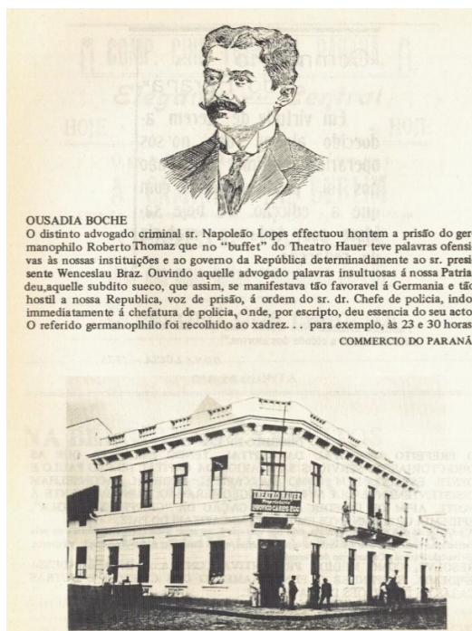
Figura 4 – O Mez da Grippe – cena do teatro Hauer