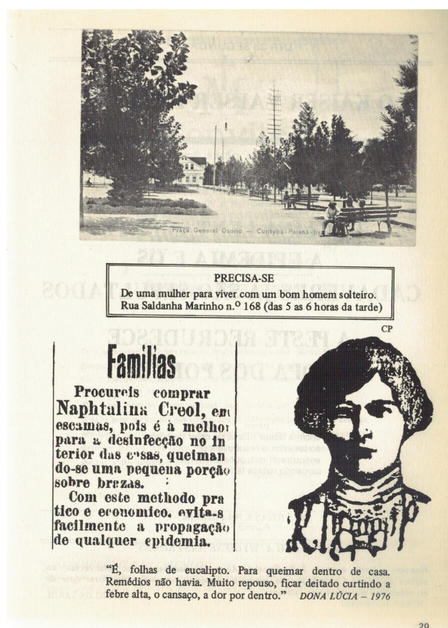
Figura 3 – O Mez da Grippe - colagens

Santiago (1989) aponta que a ficção existe para falar da incomunicabilidade de experiências. Um diálogo em literatura (expresso em palavras) fica aquém ou além das palavras. A dificuldade de se narrar a experiência pós-moderna fraturada abre espaço para o não dito. Assim, não só as palavras não são suficientes, o que abre espaço para outras linguagens. Como o espaço em branco, o não dito permite a participação ativa do leitor no preenchimento desses espaços, atuando como coautor na obra pós-moderna contemporânea.