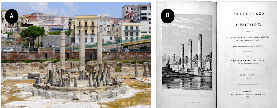
Figura 2: A. Registo fotográfico das ruínas do Templo de Serápis em Itália. B. Contracapa do livro “Principles of Geology” (publicado em 1830) de Charles Lyell. É de salientar a gravura das ruínas do Templo de Serápis em Pozzuoli, demonstrando a importância das suas observações neste local para o seu trabalho.

O crescente interesse de Charles Lyell, aliado à necessidade de fundamentar as suas ideias, foram responsáveis por várias das suas viagens pela França e Itália. Numa destas viagens, em Pozzuoli (Itália), Lyell visitou as ruínas romanas do Templo de Serápis (fig. 2A) e observou que as colunas desse monumento apresentavam, a uma certa altura, marcas de fixação de moluscos. Esta observação permitiu-lhe afirmar que aquelas colunas já teriam estado submersas, sendo esta uma evidência de que importantes mudanças geológicas poderiam ocorrer de forma gradual (Amador & Contenças, 2001).