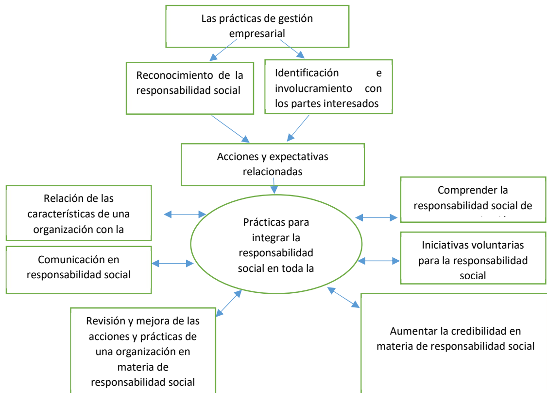
Figura: 1 Prácticas de gestión empresarial