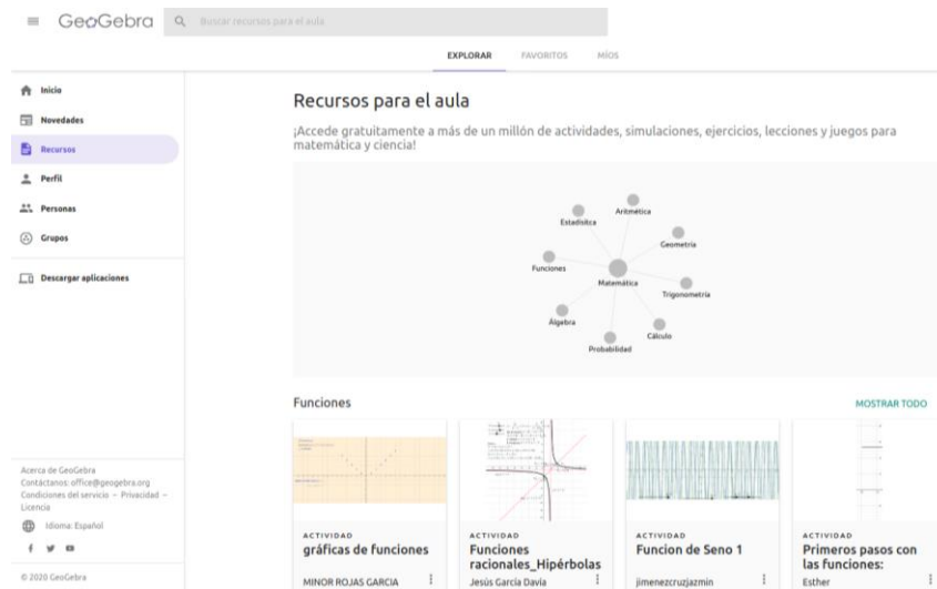
Figura 1: Repositorio de REA de GeoGebra Recursos para el aula .