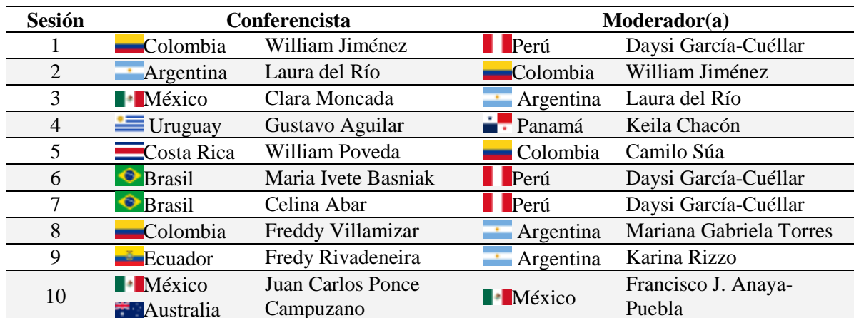
Tabla 1: Detalle de las sesiones del Año 1 del Coloquio GeoGebra 10