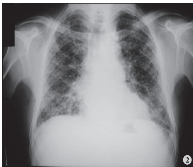
Figuras 1 e 2. Opacidades reticulares difusas predominantemente em bases e cursando com volumes pulmonares reduzidos. Evolução do paciente acima na figura 1 em 1998, e na figura 2 em 2008.