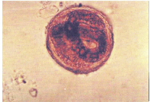
Figura 2 - Ovo larvado infectante de Toxocara canis . Coloração pelo lugol.

O homem adquire a LMV pela ingestão de ovos larvados, principalmente, de Toxocara canis .