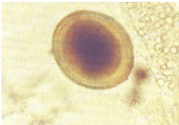
Figura 1 - Ovo de Toxocara canis nas fezes do cão. Coloração pelo lugol.