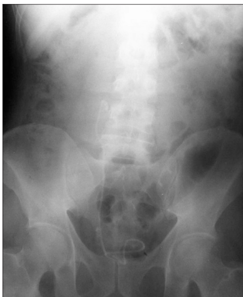
Figura 2. Cintilografia renal DTPA/DMSA mostrando ausência de captação do rim esquerdo e exclusão renal