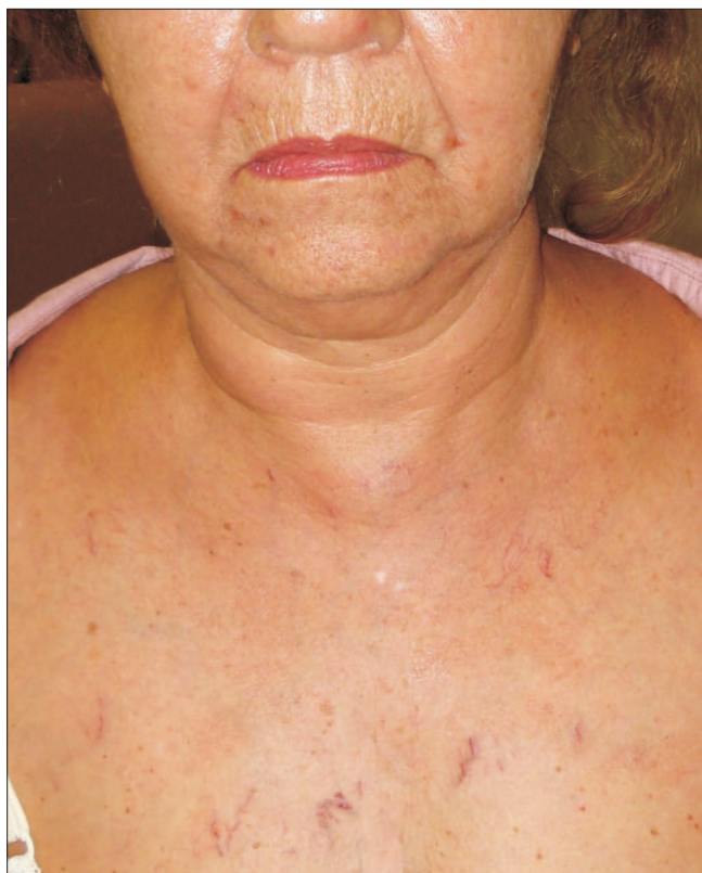
Figura 1. Imagem de uma paciente com diagnóstico de adenocarcinoma de pulmão em que possível observar a presença de sinais típicos da SVCS: distensão das veias cervicais, edema de face e pescoço e circulação colateral torácica.

O tratamento empregado na SVCS é dependente da etiologia da enfermidade. Para os casos específicos de tumoração maligna, suporte clínico com corticóide e diuréticos, radioterapia, quimioterapia, angioplastia com stent endovascular, anticoagulação e cirurgia intervencionista são opções disponíveis a serem consideradas.