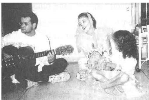
Figura 2 - Comemoração do Dia das Crianças com presença de palhaço e grupo musical.