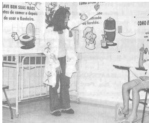
Figura 1 - Campanha Interna de Prevenção de Parasitoses Intestinais.