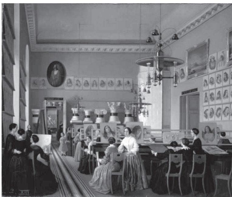
Fig. 5 – Ekaterina Khilkova. O Interior do Departamento de Mulheres da Escola de desenho de São Petersburgo para auditores . Pintura à Óleo. 73 x 89 cm. 1855.

Ainda que as diferenças de gênero não aparentem ser ponto essencial nos estudos de arte, devemos compreender que o arcabouço social que posiciona as pessoas do sexo masculino e feminino de forma assimétrica em relação à linguagem, aos significados e ao poder social e econômico, é extremamente relevante. Ao estudarmos as vanguardas artísticas russas, numa perspectiva de revisão do cânone e em comparativo aos discursos e práticas de seus colegas artistas ocidentais, vislumbramos um excelente lembrete de alguns valores, que infelizmente não foram apontados nos registros históricos.