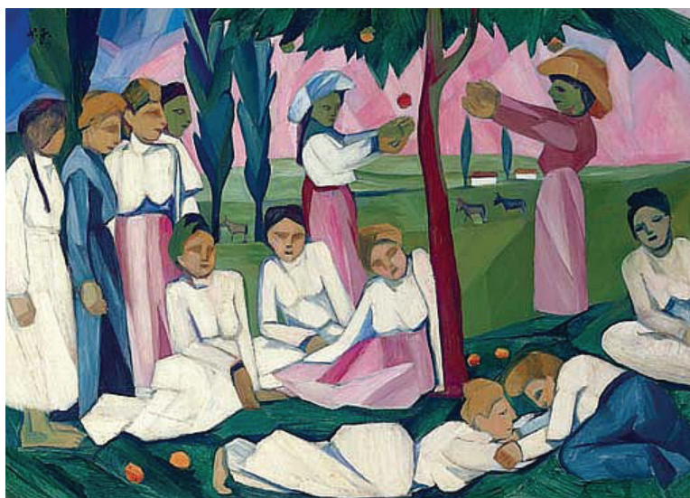
Fig. 3 - Natalia Goncharova. Colhendo maçãs .

recente pretendem é justamente interromper e superar o narcisismo universalista modernista, extremamente misógino, que consegue ecoar um sistema de exclusão e objetificação até hoje. Tomamos como exemplo atual o trabalho do artista russo Andrei Tarusov, que lançou um celebrado calendário de pin-ups vermelhas para homenagear o centenário da Revolução, reforçando o negativo estereótipo do esquerdo-macho 3 .