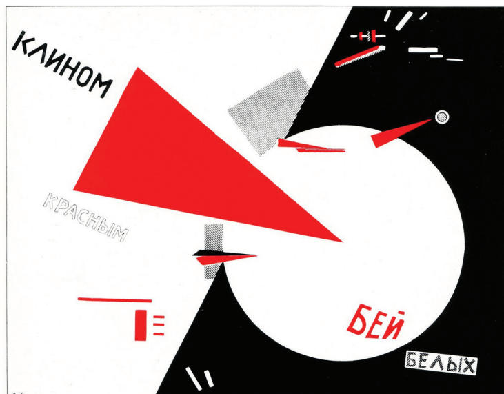
Fig. 2 - El Lissitzky. Vencendo os brancos com a cunha vermelha .

Litografia/cartazes. Tamanhos diversos. 1919.