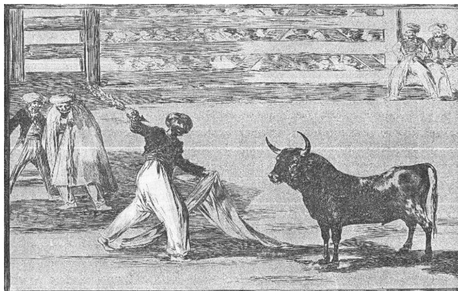
Gravura 2. Origem dos arpões e bandarillas . – Água-forte, água-tinta polida, ponta seca e buril – 25 x 35 cm. Fonte: Hofer, 1969.

tureiro a uma estatura heróica, e nada fazia para desmerecer o aficionado (HUGHES, 2007). Goya desenhou e gravou seus toureiros e picadores mouros nos uniformes mamelucos que vira os mercenários de Napoleão usar em Madri e, assim paramentados, eles introduzem armas básicas para a Touromaquia , e algumas de suas suertes populares ( suertes é uma palavra sugestivamente ambígua que significava, entre outras coisas, “destino”, “sorte” ou “palco da tourada”). Goya creditava aos mouros a invenção de tourear usando a capa ou, quando mais adequado, com um Albornoz ; concorda com a opinião de Moratín e de Pepe Illo, de que eles também introduziram “os arpões ou bandeirillas na arena para desorientar o touro por meio da dor e cansá-lo”, que é o que vemos acontecer na gravura 2.