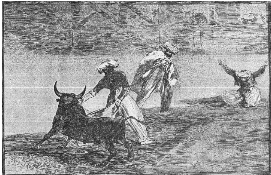
Gravura 1. Capeiam outro no cerrado . – Água-forte, água-tinta polida, ponta seca e buril – 25 x 35 cm.

O cenário seguinte na história da tourada de Goya vem com a introdução de lutadores mouros, o que situa a ação antes da expulsão dos muçulmanos por Fernando e Isabel, em 1502. A idéia de que os mouros fossem particularmente interessados por touradas, tendo sido responsáveis em ampla medida por sua transformação em ritual social, é historicamente falsa; na verdade elas não tinham interesse especial pela tourada.