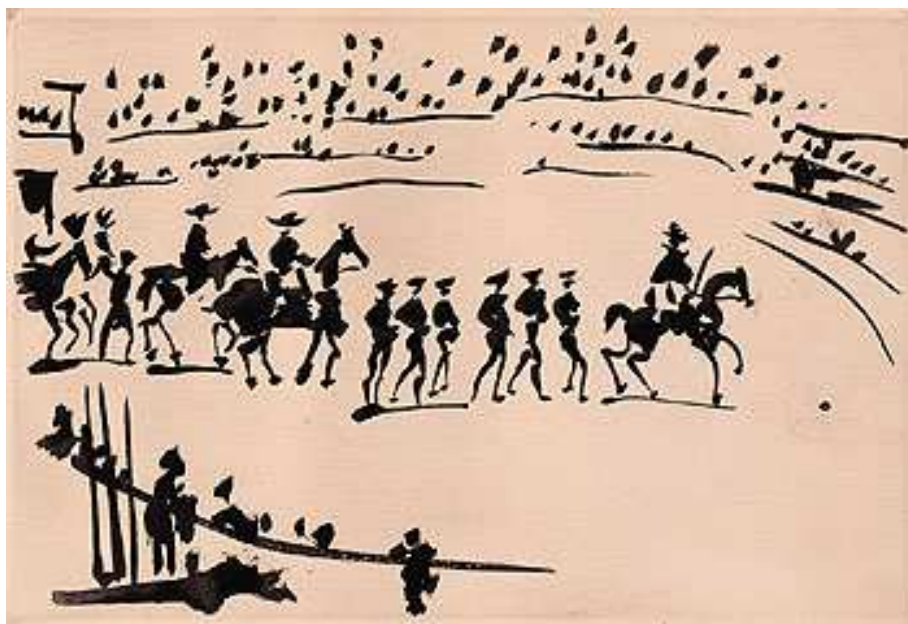
Gravura 3. O Desfile das Quadrilhas - Água-tinta, açúcarada -1959-35.5 x 50 cm.