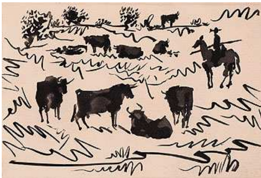
Gravura 1. Touros no Campo - Água-tinta, açúcarada -1959-35.5 x 50 cm.

Picasso era nomeado patrono de honra de muitas corridas. Em resposta, ele, que detestava envergar trajes convencionais e gostava só de suas calças listradas de branco e preto e de sua camisa grosseira de pescador, vestia um terno azul marinho de burguês, camisa branca e uma gravata, seu mais alto tributo a qualquer ocasião. Ninguém em Arles suspeitaria quanto lhe custava tal gesto, pois neste período de vida Picasso não gostava de sair.