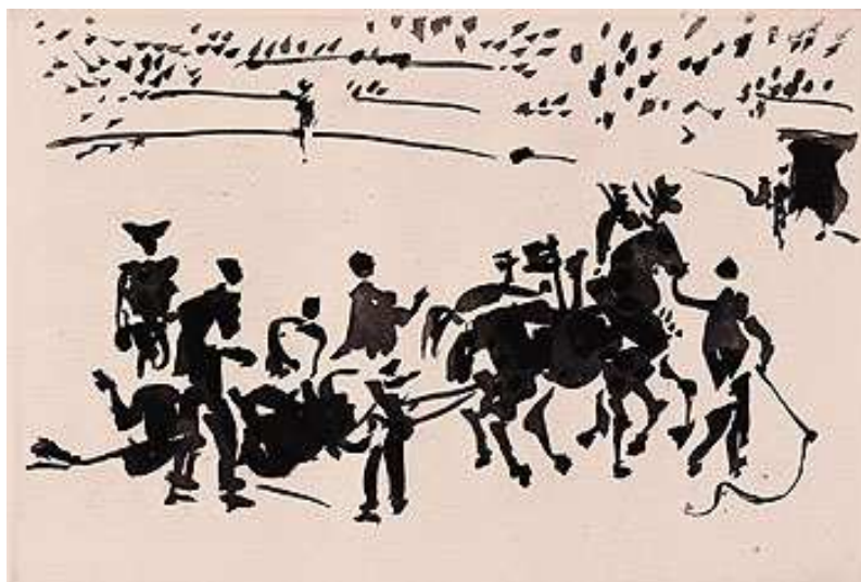
Gravura 4. O arrasto do touro - Água-tinta, açúcarada -1959-35.5 x 50 cm.

toureiros nos ombros de seus adeptos, quando ao seu desempenho como matador foi excepcional, e com a concordância do Presidente da praça. A porta do medo por onde entram os touros; aliás, poderíamos chamar, também, de porta da vida. E a porta da morte, por onde são levados os touros mortos, puxados por uma parrelha de cavalos. Esse cenário pode ver na gravura 4 da Tauromachie de Picasso.