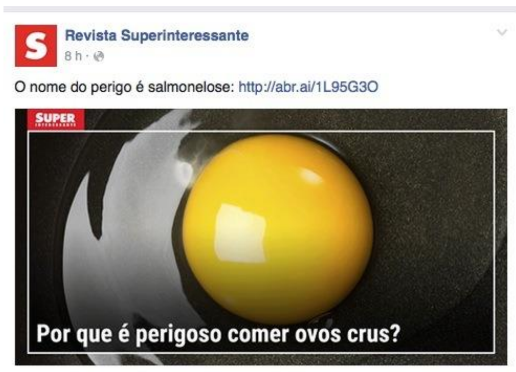
Fig.6 – postagem publicada pela Revista Superinteressante no Facebook , publicada em 15.05.2015.

Do ponto de vista tecnológico, o surgimento de ferramentas de comentário e resposta também é uma questão importante no que tange à conclusibilidade, sobretudo porque nos levanta uma problemática metodológica. Nas Figuras (6) e (7), temos um exemplo de como os comentários podem se desenrolar em uma página de rede social. A partir do enunciado-fonte, que apresenta uma reportagem sobre o perigo da salmonela, os leitores não respondem somente à publicação, mas também correspondem-se entre si: