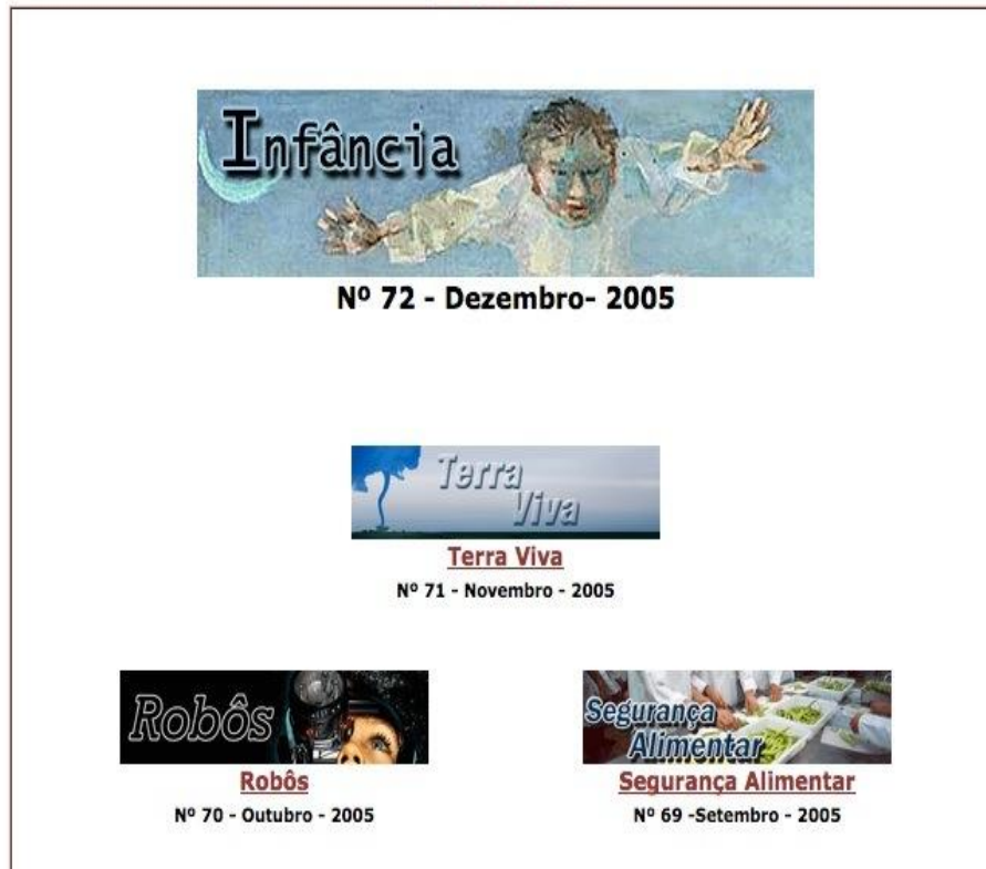
Fig.1 – Apresentação dos dossiês temáticos do site Com Ciência na Web 1.0.