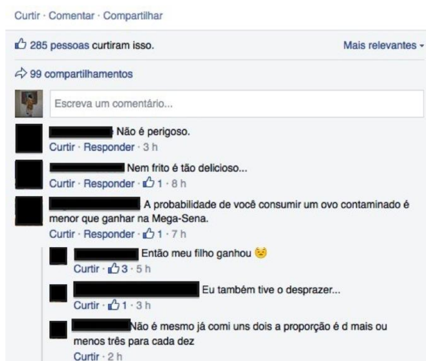
Fig.7 – Comentários da postagem da Revista Superinteressante no Facebook , publicada em 15.05.2015.

Além disso, há outros aspectos que afetam a conclusibilidade dos enunciados. Os comentários podem ser adicionados a qualquer momento. Uma postagem feita há dois anos no Facebook pode receber respostas no dia de hoje, por exemplo. Outro problema é o fato de as respostas poderem ser apagadas. Em alguns sites , o autor tem domínio sobre os comentários, podendo ele mesmo aceitar ou apagar o comentário de um terceiro. Essa apropriação do enunciado de outrem é passível de escapar aos olhos do analista. Em outros sites , o próprio autor da resposta pode decidir mantê-la, modificá-la ou apagá-la. Logo, como captar os apagamentos e mesmo as edições contínuas de enunciados nativos digitais? Por mais que o enunciado fonte preserve a sua conclusibilidade dada pelo ponto final do autor, o mesmo enunciado também se completa pelos sentidos das respostas diretas, em que uma nova conclusibilidade pode ser estabelecida.