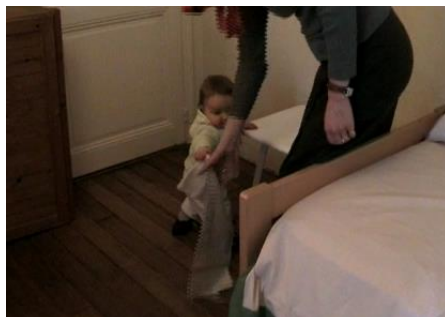
Figura 3 - Mãe pega objeto da mão da criança enquanto afirma mas sim o que isso faz aqui?

A vocalização de M nesse Episódio 3 foi interpretada por sua mãe como um enunciado completo, embora sem a presença de palavras. A fala da mãe de M mais oui qu'est-ce que ça traîne ça? (que pode ser traduzida como “mas sim o que isso faz aqui? ou por que isso está jogado aqui?”) sugere ser uma interpretação, na qual a criança indicava que o objeto (pano) não estava em local adequado (Fig. 3). Essa configuração ilustra como o adulto e a criança experimentam, nos balbucios, cenários de apropriação enunciativa, na medida em que com os balbucios emergem. Ao mesmo tempo, ilustra o empenho da mãe para completá-los, preenchendo-os com suas próprias palavras, propiciando-lhes acabamento. A apropriação enunciativa é refletida na medida em que bebê e mãe se alinham mutuamente para partilhar pontos de estabilidade dinâmica no diálogo. Esses pontos são as sucessivas respostas, ou melhor, a dinâmica de responsividade no diálogo.