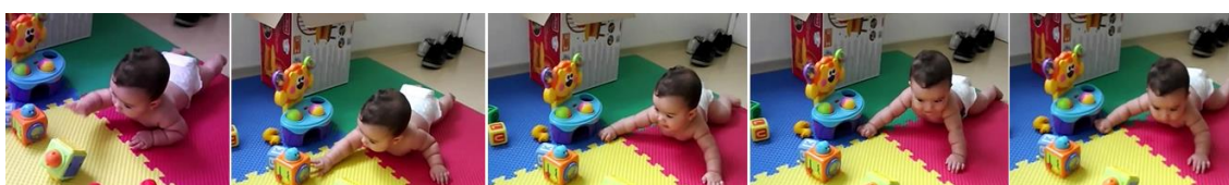
Figura 1 - V tenta alcançar objeto, eleva o corpo, olha para o brinquedo e vocaliza

De maneira geral, a mãe de V interpretou que a criança estava descontente com a situação ( diga eu não tô (estou) gostando não disso – linha 14). Observamos como o adulto, ao lidar com ações e balbucios da criança, se engaja em tentativas de interpretação desses sinais, atribuindo sentido às produções infantis. Com essa constatação, marcamos também que a vocalização da criança, embora ainda sem as palavras da língua, revelou as características de altura, intensidade e duração elevadas, que possibilitaram a interpretação da mãe de que seu balbucio era uma expressão de protesto. Neste caso, as ações infantis (tentar alcançar brinquedo, manter o olhar fixo nele com certa tensão corporal), aliadas à vocalização com traços prosódicos específicos, possibilitaram à mãe a atribuição de sentido de queixa ou reclamação à criança.