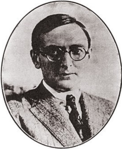
Renato Ferraz Kehl

Na tentativa de difundir o movimento no Brasil e assim atrair maior número de adeptos entre médicos, farmacêuticos, e intelectuais de diversas áreas, o Boletim de Eugenia destacava em diversos artigos, teóricos que discutiram a origem da vida, princípios de hereditariedade, concepções antropológicas e sociais que, acreditamos, davam base ao discurso “científico” da eugenia.