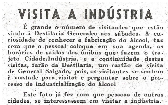
Imagem 3. Visita a indústria