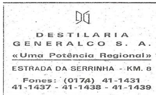
Imagem 4. Logotipo da empresa que se institui como potencia regional