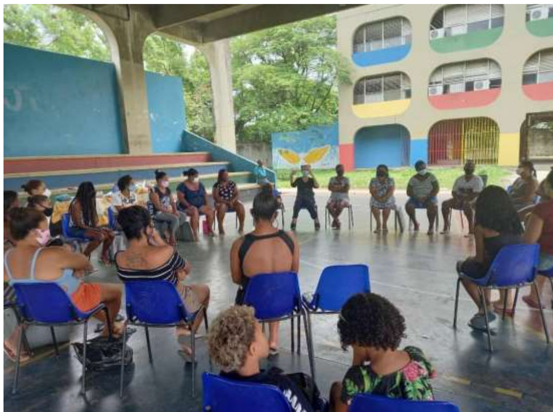
Imagem 02 - Encontro da Roda de Mulheres no Ciep 350 Túlio Roberto Cardoso Quintiliano. Espaço usado quando se tem a necessidade de um espaço maior do que a sala de leitura.

As oficinas são oferecidas por voluntários diversos que foram se integrando ao projeto ao longo desses anos.