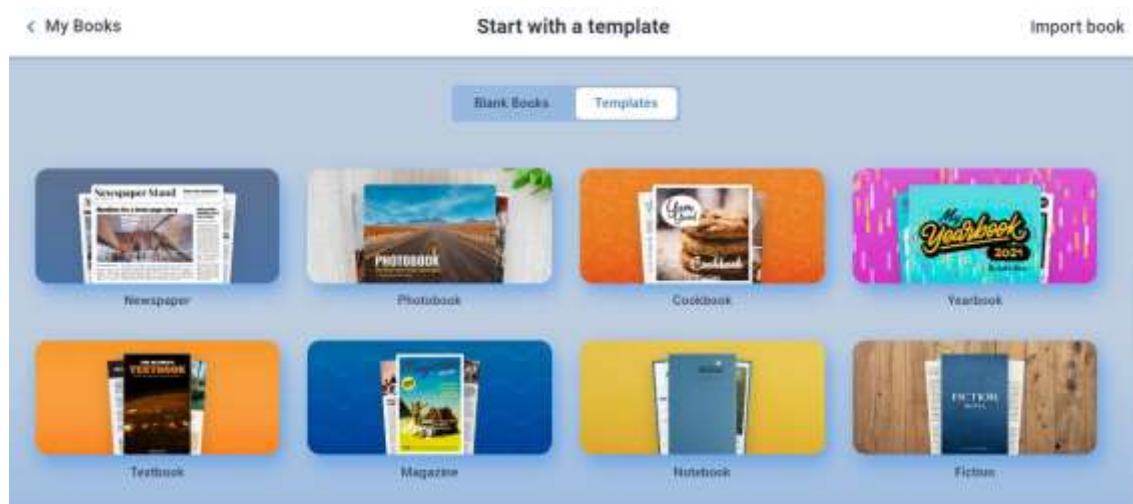
Figura 2 - Livros temáticos a partir de suportes e gêneros textuais diversos