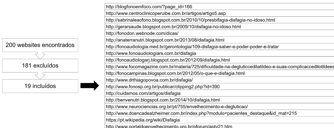
Figura 1. Websites incluídos sobre disfagia orofaríngea no idoso

(artigos, teses, monografias, pesquisas, capítulo de livro), cartilhas, cursos online para profissionais, currículos de profissionais e grade curricular de universidades.