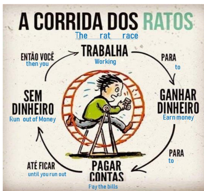
Figura 1 - Representação da corrida dos ratos