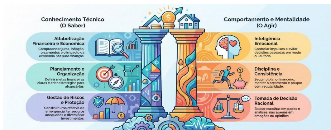
Figura 2 – Pilares da inteligência financeira