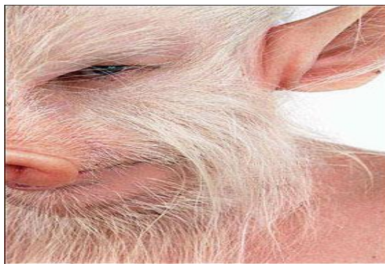
O New Design de Isaiah

“Isaiah, o matemático, o menino”, termina camuflado sob os advérbios de modo reduzidos, que por imperativo lógico e lingüístico são formados de palavras femininas e aplicáveis comumente a personagens de sexo ou tendência feminina. “Isaiah foi plena, visceral, lindamente feliz. Hilde também (sic) (HILST, 2002, p. 08). Logo, nesse desfecho, sua “gestalt” revelou-se, juntaram-se suas partes, viu-se o todo – Isaiah parece vir à luz. Eis seu New Design . Puro ou impuro? Corpo-porco? Quem é Isaiah? Quando a alma vira lama, o porco anagramático é corpo (psicossomático).