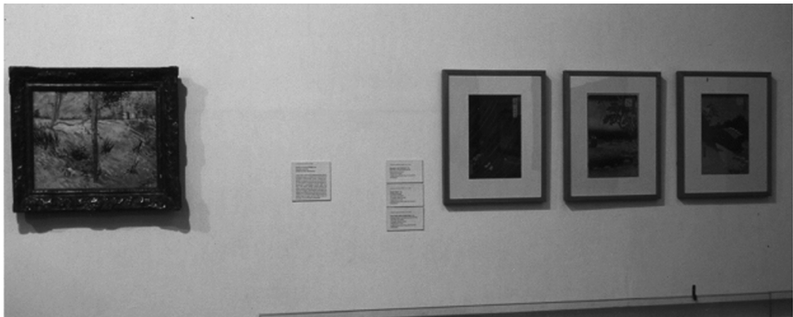
Cildo Meireles, Fontes , XXIV Bienal de São Paulo, 1998. Acima, vêem-se três gravuras de Horoshige e, à esquerda, uma pintura de Van Gogh

Para relacionar as duas Fontes , considera-se que ambas estão em co-presença e as marcas de transtextualidade são, conforme a definição de Gerard Genette, de dois tipos: paratextual e intertextual. O primeiro tipo, o paratexto, é identificado no conteúdo das etiquetas das obras: na da obra exposta na Bienal descreve-se a instalação que só é vista em outra exposição e, deste modo, é estabelecida com o visitante uma relação contratual por meio da qual o mesmo passa a considerar em sua leitura a presença da obra ausente. Essa é, segundo Genette, uma relação menos explícita que a que analisamos neste trabalho: a citação pelo uso de certos constituintes eidéticos em ambas as obras.