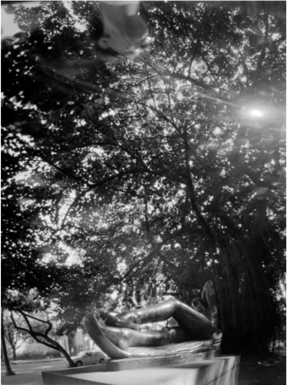
Díptico: depois do banho, 2001.