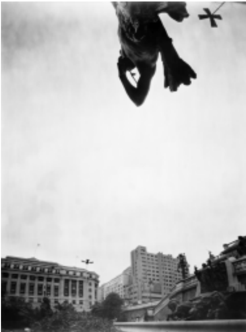
Triptico: guarani, 2001.