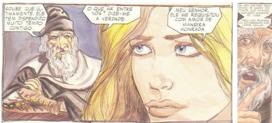
Fig.28. Adapt. Grant e Mandrake, p.10. Fig.29. Adapt. Grant e Mandrake, p.10.

Na adaptação de Grant e Mandrake, o olhar inquisidor do conselheiro Polônio em relação à sua filha Ofélia (Fig.28), ao invés de evoluir para uma cena de violento sermão ou de vaidade pela detenção de alguma sabedoria distante, retrata um semblante em que, ainda que o dedo esteja em riste, os olhos mais oblíquos traduzem uma preocupação paternal evitada de afetiva proteção (Fig.29).