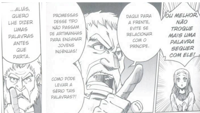
Fig.25. Adapt. East Press, p.34. Fig.26. Adapt. East Press, p.36.

A Equipe East Press enfatiza o caráter autoritário que Polônio exerce nos filhos quando elege a atribuição de um olhar fixo do conselheiro aos seus interlocutores e a conservação de um semblante ríspido. No caso da fala dirigida à filha Ofélia, o retrato da repreensão severa é traduzido por alguns elementos plásticos: o contorno do balão e a tipografia em negrito e em fonte maior de fala do conselheiro marcam o volume e a gravidade das imposições de Polônio (Fig.26). Em relação à expressão facial, a personagem, nesse mesmo quadro, atinge uma combinação enraivada prevista por Scott McCloud (2008, p.92-93): o músculo corrugador franze o cenho somado à elevação de pálpebra assim como os músculos levator labii superioris , depressor labii inferioris e risorius produzem uma boca mais enquadrada de predador.