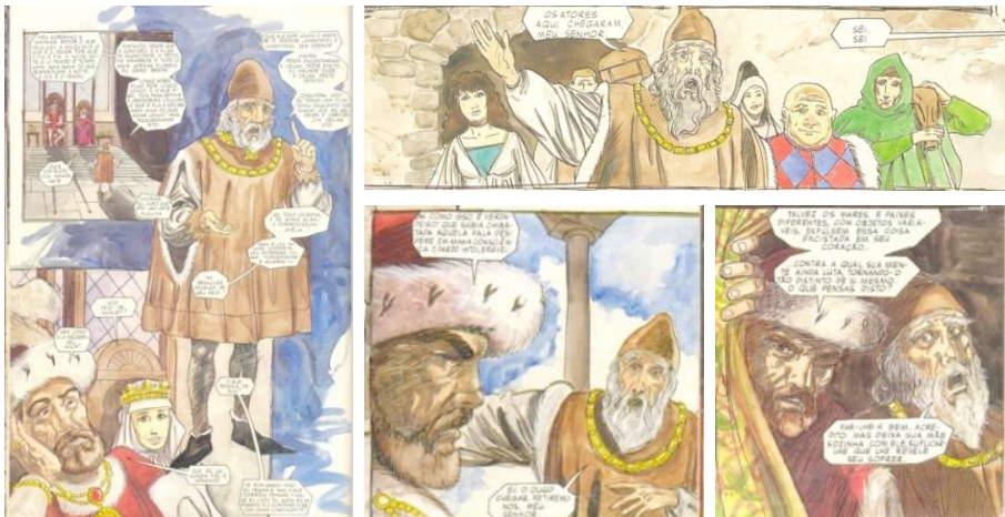
Fig. 9. Adapt. Grant e Mandrake, p.16. Fig. 10. Adapt. Grant e Mandrake, p.23. Fig.11. Adapt. Grant e Mandrake, p.25. Fig.12. Adapt. Grant e Mandrake, p.27.

A partir dessa consideração de Pina, podem-se investigar algumas peculiaridades nas escolhas de cada quadrinho como uma forma de reinterpretação e recriação do conselheiro Polônio. A obsessão pela fala performática do conselheiro real é indicada de forma diferente em cada uma das adaptações por exemplo. Na narrativa gráfica de Steven Grant e Tom Mandrake, a boca aberta ou a multiplicação de balões na personagem Polônio sinalizam o caráter teatral da fala do conselheiro (Fig.9, 10, 11 e 12).