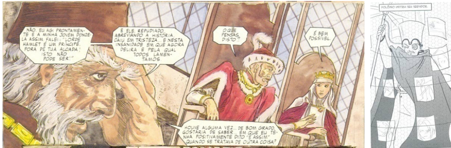
Fig. 4. Adapt. Grant e Mandrake, p.17. Fig. 5. Adapt. Vieceli, p.58.

Quanto ao vestuário do conselheiro Polônio, é interessante notar que o quadrinho de Emma Vieceli associa a manta de aspecto mais conservador e de recordação medieval a uma versão de roupa mais atual com costura e botões (Fig.5). Em verdade, a perspectiva futurista de Vieceli sintetiza um diálogo entre antigo e moderno – próprio do ciclo da moda. E isso também acontece se for observado um dos itens de composição dessa personagem: o bastão. O bastão de Polônio relembra a autoridade de sábios desde Moisés, entretanto tal instrumento também é o que permite a exibição e a gravação de hologramas. Em relação à postura corporal, o mangá de Vieceli (Fig.8) e o da Equipe East Press (Fig.6 e 7) repetem um trajeito performático e significativo para a construção do conselheiro Polônio. A introdução da tosse como preparação dramática de um discurso mais sério, representativo ou de uma defesa de opinião mais contundente frente à autoridade real acontece tanto na adaptação da Equipe East Press quanto na de Emma Vieceli.