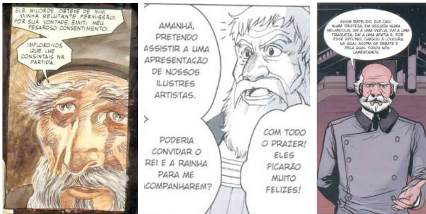
Fig.1. Adapt. Grant e Mandrake, p.5. Fig.2. Adapt. East Press, p.71. Fig.3. Adapt.Srbek e Shibao, p.23

As quatro adaptações, inevitavelmente, utilizam-se desses recursos para a composição do conselheiro real Polônio. É possível até se constatarem algumas coincidências em relação à escolha dos artistas de HQ envolvidos nesse estudo. A marca de sabedoria e maturidade, por exemplo, é indicada pela barba longa da personagem nas versões de Grant e Mandrake (Fig.1) e da Equipe East Press (Fig.2) ou ainda pela barba branca nessas duas e mais na adaptação de Srbek e Shibao (Fig.3).