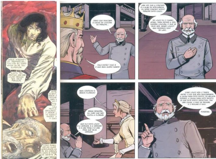
Fig.13. Adapt. Grant e Mandrake, p.34. Fig.14. Adapt. Srbek e Shibao, p.23

Diferentemente, a adaptação de Srbek e Shibao não faz tanto uso da técnica da multiplicação dos balões em um só quadro – o que obriga tal HQ a aumentar a participação de Polônio nos quadros e a realizar um resumo maior de suas falas. Com isso, ocorrem duas consequências bem diretas na construção dessa personagem nos quadrinhos de Srbek e Shibao. A primeira delas é que, por causa da necessidade maior de colocarem em quadros sequenciais o conselheiro Polônio em suas falas mais longas, os quadrinistas exploraram as posturas corporais da personagem, suavizando o caráter verborrágico e enfatizando a dimensão performativa de suas falas (Fig.14). A segunda delas é que essa manutenção da personagem em diversos quadros sequenciais obrigou os quadrinistas, por economia de edição, a eliminarem cenas importantes em que se caracterizava a personagem Polônio como figura paterna: as falas com o filho Laertes ou sobre o mesmo simplesmente foram eliminadas, e a orientação de afastamento inicialmente dada à filha Ofélia também foi subtraída. Ainda que tais cenas estejam retiradas, essa adaptação, em decorrência das escolhas de enquadramento, possui a maior porcentagem de ocorrências da personagem Polônio por quadro.