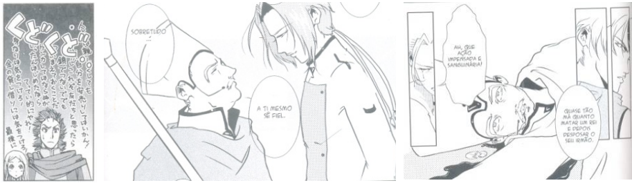
Fig.16. Adapt. East Press, p.34. Fig.17. Adapt. Vieceli, p.45. Fig.18. Adapt. Vieceli, p.132

hamletiana sem que se deturpe a mistura de gêneros entre tragédia e comédia que, por vezes, o dramaturgo Shakespeare também realiza em suas obras (Fig.16). No caso da versão de Emma Vieceli, a história foi recriada para ocupar um contexto futurista, cibernético e distópico, e isso, invariavelmente, também repercute na composição da personagem Polônio. A fala frequente do conselheiro real é simbolizada pelo microfone auricular agarrado à boca (Fig.17). Na cena da morte de Polônio, num close-up realizado na face dele, o sangue saído da boca sinaliza para a fala excessiva e intrometida do conselheiro como um dos motivos de seu assassinato. Nesse mesmo quadro, o monóculo, símbolo de sabedoria na versão de Vieceli, aparece rachado com a queda do morto (Fig.18) – com o falecimento de Polônio, extinguem-se também o conhecimento estratégico e a arte da persuasão discursiva elaborados em tempos anteriores.