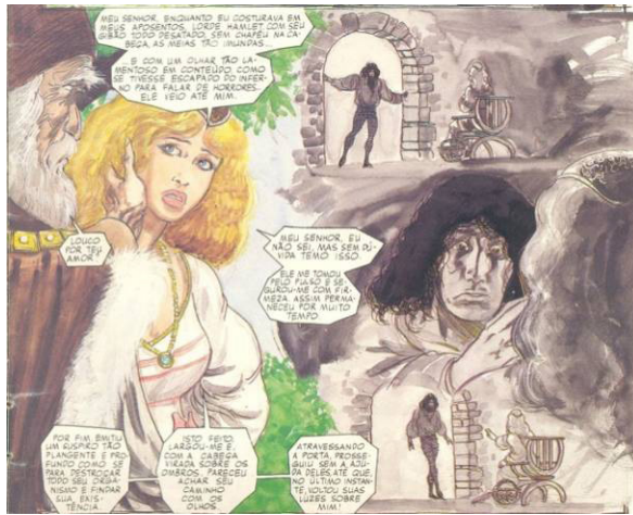
Fig.34. Adapt. Grant e Mandrake, p.15.

A ideia de projeção de Polônio como o ser desejoso de Hamlet parece ainda mais pertinente quando se observa que Mandrake cola duas imagens muito semelhantes entre o pai e o pretendente de Ofélia. Na ilustração à esquerda, Polônio toca a face da filha; na ilustração à direita, Hamlet realiza o mesmo gesto. Importante verificar que Tom Mandrake compõe tais momentos do desenho como um jogo de reflexos. A posição do olhar para o fundo do conselheiro Polônio surge, como no espelho da projeção almejada, no olhar para a frente do príncipe Hamlet – a face de Ofélia em posicionamentos opostos compõe um dos principais elementos que atribui a noção de reflexo ao espelho. Nesse sentido, o tom cinzento das ilustrações à direita pode sugerir dois sentidos. Um mais literal: a recordação de Ofélia sobre o encontro com o príncipe. E outro mais profundo: a projeção de Polônio ao fantasiar-se como Hamlet.