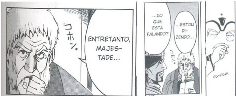
Fig. 6. Adapt. East Press, p.59. Fig. 7. Adapt. East Press, p.62. Fig. 8. Adapt. Vieceli, p.84.

Quanto ao vestuário do conselheiro Polônio, é interessante notar que o quadrinho de Emma Vieceli associa a manta de aspecto mais conservador e de recordação medieval a uma versão de roupa mais atual com costura e botões (Fig.5). Em verdade, a perspectiva futurista de Vieceli sintetiza um diálogo entre antigo e moderno – próprio do ciclo da moda. E isso também acontece se for observado um dos itens de composição dessa personagem: o bastão. O bastão de Polônio relembra a autoridade de sábios desde Moisés, entretanto tal instrumento também é o que permite a exibição e a gravação de hologramas. Em relação à postura corporal, o mangá de Vieceli (Fig.8) e o da Equipe East Press (Fig.6 e 7) repetem um trajeito performático e significativo para a construção do conselheiro Polônio. A introdução da tosse como preparação dramática de um discurso mais sério, representativo ou de uma defesa de opinião mais contundente frente à autoridade real acontece tanto na adaptação da Equipe East Press quanto na de Emma Vieceli.