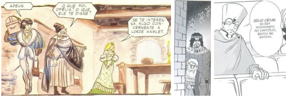
Fig.19. Adapt. Grant e Mandrake, p.10. Fig.20. Adapt. East Press, p.98. Fig.21. Adapt. Vieceli, p.108.