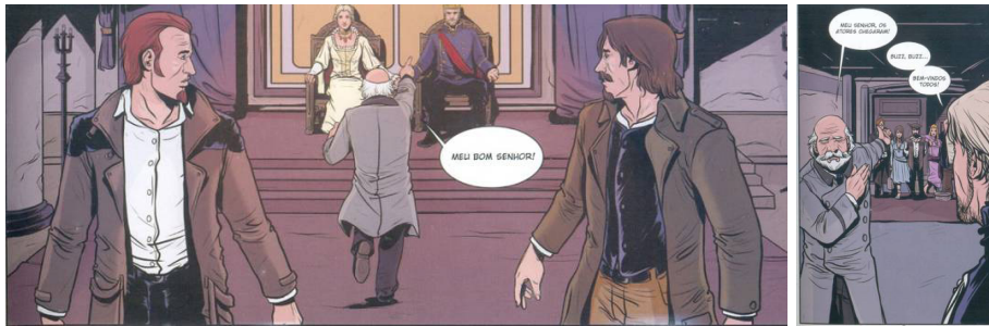
Fig.22. Adapt. Srbek e Shibao, p.23. Fig.23. Adapt. Srbek e Shibao, p.31