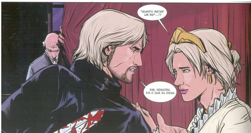
Fig 15-Adap. Srbek e Shibao, p.42

As adaptações em mangá também realizam estratégias distintas para a descrição do caráter da personagem Polônio. Na adaptação da Equipe East Press, as falas de Polônio poluem um quadro específico. Embora a personagem não apareça no quadro, o volumoso discurso é uma presença física a espremer os filhos. Em meio a tanto palavrório a ocupar os espaços do quadro, Ofélia enrubesce, e Laertes sua no rosto apreensivo – a Equipe East Press constrói uma oportunidade de inserir a comicidade própria de muitos mangás na peça