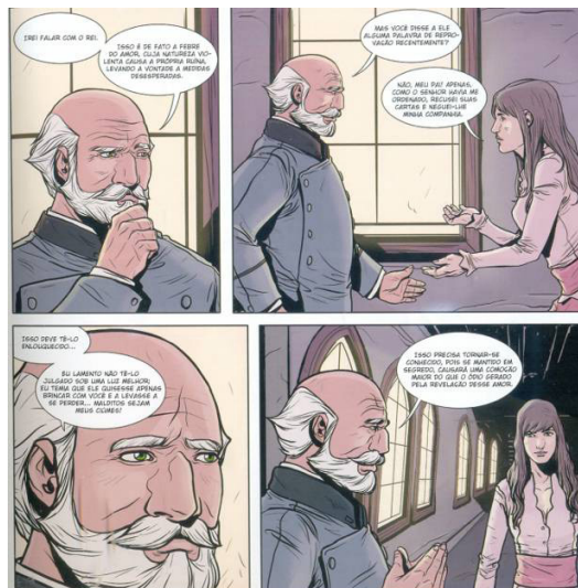
Fig.24. Adapt. Srbek e Shibao, p.21.

Uma das características destacadas por Northrop Frye (1992, p.117) para a composição da personalidade do conselheiro Polônio é o seu excessivo controle sobre os filhos. Contraditoriamente, a adaptação de Srbek e Shibao reduz todo o poder de atuação paterna do conselheiro Polônio à sua missão de conselheiro real. Por um lado, os quadrinistas retiram as cenas de interlocução com o filho Laertes e de aconselhamento inicial à filha Ofélia; por outro lado, o desenho facial sereno de Polônio ao falar com Ofélia não sugere qualquer sentimento de maior afeto ou paternalidade. Ao contrário disso, o seu gesto de levar a mão ao queixo dá ao leitor a impressão de que pode levar vantagens com a versão da história sobre a loucura de Hamlet relatada por Ofélia (Fig.24).