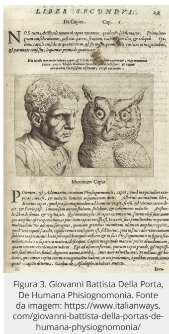
Figura 3. Giovanni Battista Della Porta, De Humana Physiognomia.