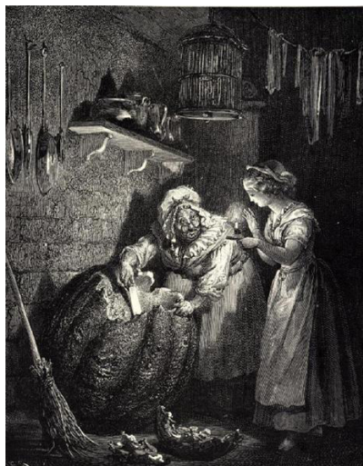
Figura 6. Cinderela, por Gustave Doré. Fonte da imagem: https://www.wikiart.org/pt/gustave-dore/cinderela-0

Mas a Cinderela que conhecemos como a enteada maltratada pela madrasta e suas filhas nem sempre teve um final feliz. Em seu História Noturna – decifrando o sabá , Carlos Ginzburg diz que essa história remonta ao século IX, na China.