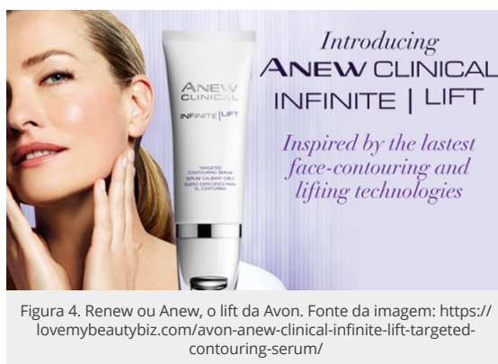
Figura 4. Renew ou Anew, o lift da Avon. Fonte da imagem: https://lovemybeautybiz.com/avon-anew-clinical-infinite-lift-targeted-contouring-serum/

Uma das maiores empresas cosméticas do mundo, a Avon , originalmente americana, fundada em 1886, mas assim batizada em 1939, tem uma linha de cosméticos que vai de cremes faciais, passando pelo batom e base, até cremes para pés e mãos chamada Renew (renovar, reavivar, rejuvenescer). Nesta, chamam atenção nomes como “Sérum reparador maximizador de Juventude”, da linha Renew Smart (adjetivo que pode fazer supor uma certa hierarquia na qualidade dos produtos); Infinity Lift (cuja promessa de eternidade compete com nada mais nada menos do que a própria lei da gravidade) e Renew ultimate . Ultimate diz do que é elementar, fundamental, mas também alude a uma solução conclusiva, extrema, categórica, definitiva, inapelável. Mais do que isso, só o milagroso ou divino. E, sim, não faltam miracles — em inglês, mas também em bom francês — nos títulos dos cosméticos.