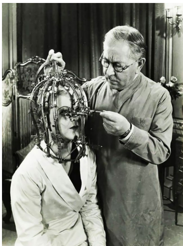
Figura 1. Max Factor beauty-calibrator ou calibrator machine ou ainda make-up applicator .

Em 1914, Max Factor inventa um creme ultrafino em consistência e ao mesmo tempo espesso o suficiente para cobrir a epiderme. Além de funcional, Max Factor consegue produzir uma paleta com 12 gradações de cores. Esse experimento, que tornou o tecnicolor mais agradável, foi o catalizador do icônico pan-cake da Max Factor. Portátil, o creme das estrelas vinha numa embalagem charmosa e prometia uma aplicação descomplicada, o que fez desse item o maior sucesso comercial da Max Factor. Chaplin, Keaton e outras estrelas do dito cinema mudo são usuários dos seus compostos. Para Phyllis Haver, inventa os cílios postiços; com Douglas Fairbanks, se dá a primeira prova da resistência dos corantes à transpiração corporal; o efeito “blur” ou “smear” que immortalizou Joan Crawford também é legado de sua maestria alquímica e o galã Rodolfo Valentino recebe cobertura amarelada para simular uma pele mais bronzada e saudável.