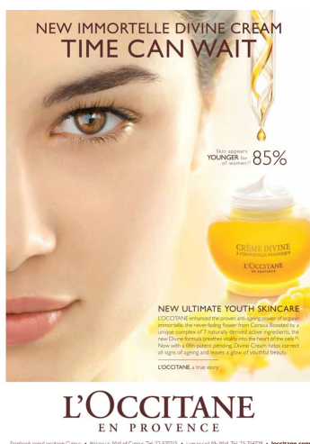
Figura 5. Prometendo imortalidade em forma de creme, o anúncio do Crème divine, da L'Occitane, diz que o tempo pode esperar.

Na francesa L'Occitane , também comercializada no Brasil, podemos encontrar linhas como Precieuse Immortelle , Collection Divine (que têm cremes como Divine Immortelle , Regard divin immortelle — algo como divina imortal e olhar/aspecto divino imortal), produtos como Harmonia divine (a harmonia divina é possível ser comprada em creme e sérum ), além de produtos com perfectrice (perfeição), sublime e o huile jeunesse divine (óleo ou azeite da juventude divina). O que nos lembra a relação ancestral, mágica e semiótica entre nome e coisa.