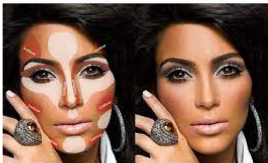
Figura 7. O jogo de sombreamentos da técnica de maquiagem contouring , popularizada pelos tutoriais da socialite Kim Kardashian.

No contour dos tutoriais das celebridades fashion , os pigmentos mais escuros são aplicados nos pontos que se pretende afilar ou alongar — como nariz (especialmente de pessoas negras, com narinas mais largas) e têmporas. Os pigmentos mais claros ou luminosos (cujas composições podem conter cintilância ou glitter ) são aplicados nas áreas do rosto para torná-las mais proeminentes. Em contraponto às sombras, essas áreas “saltam”, destacam-se, contribuindo para clarear peles escuras, afinar traços e criar volumes ou, ainda, aumentar os olhos orientais.