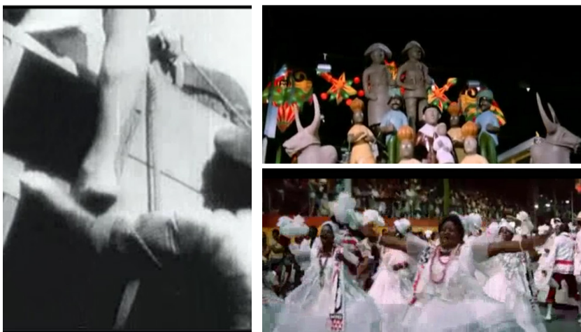
Figura 6. “Alegria” e “movimentação” nos filmes de Humberto Mauro (à esq.) e Glauber Rocha (à dir.). Fontes: O descobrimento do Brasil e A idade da Terra .

No filme de Humberto Mauro, a relação de “Alegria” é mais com a movimentação e menos com um sentimento de alegria, pois ouvimos a música assim que os marinheiros se deram conta do desaparecimento de uma das caravelas. Há, no corte, o movimento de Pedro Álvares Cabral, que se levanta junto com a música e, depois, a grande movimentação dentro do plano, com marujos subindo escadas para tomarem as providências devidas (figura 6).