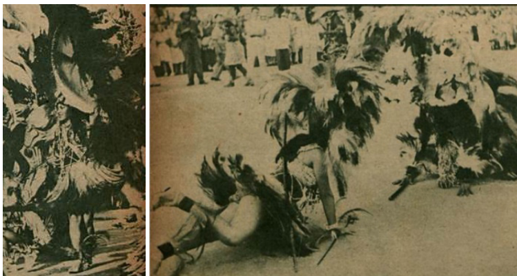
Figura 2. Desfile do “Sôdade do Cordão”.