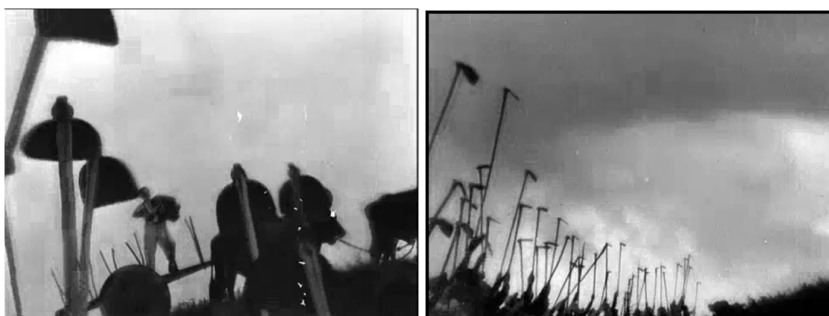
Figura 4. Trabalhadores com enxadas.

Galdino é um personagem simples, empregado de uma fazenda, apaixonado pela afilhada do fazendeiro e com inclinações artísticas para o acordeon. Durante o filme, Galdino assobia e cantarola a melodia de Villa-Lobos, mas é na sequência do seu sonho que a música é ouvida em sua totalidade. A música da sequência do sonho como um todo é formada por diversos excertos, sempre em versões de acordeon de Mascarenhas, como a abertura O Guarani (de Carlos Gomes) e Odeon (de Ernesto Nazareth), mas a parte do Canto do pajé se destaca pelas imagens de trabalhadores empunhando suas foices e enxadas, cantando coletivamente (figura 4). São imagens e sons que foram muito impactantes para os diretores do Cinema Novo, inclusive, pela sua qualidade eisensteiniana, como Guerrini Júnior e Carlos Diegues evocaram (GUERRINI JR, 2009).