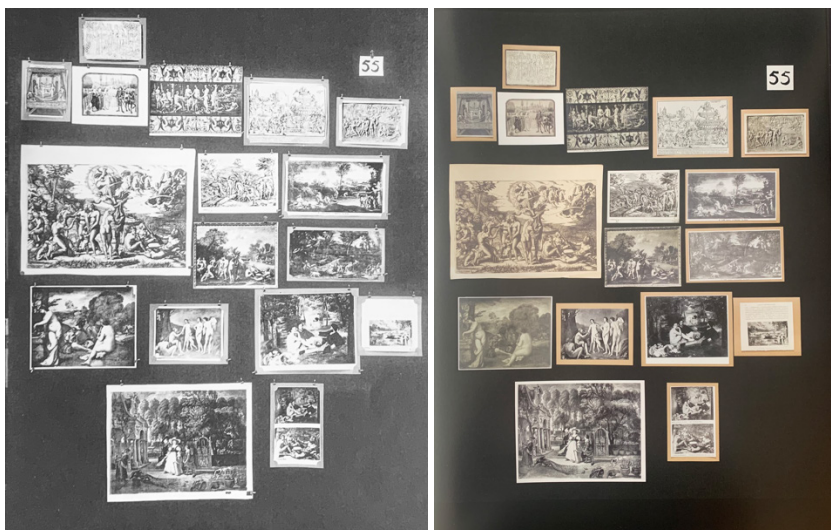
Figuras 1 e 2. Painel número 55, sobre o quadro “Le Déjeuner sur l’herbe”, de Edouard Manet, fotografado em p/b (esq.) nos anos 1920 e na nova versão “original” / Fotos: Divulgação.

Warburg usou nos seus um tecido grosso e cinza bem escuro, como um feltro de trama larga; para fixar as imagens, ele usava colchetes, que eram fixados no tecido. Quando um painel estava “pronto”, Warburg reunia seus discípulos e ditava notas, como lembretes telegráficos de ideias sobre o conjunto das imagens e seu sentido no conjunto do Atlas. Essas anotações, feitas pela assistente Gertrude Bing, servem até hoje como legendas dos painéis, nas edições do Atlas. No fim do processo, o painel era fotografado em negativos de vidro, em alta resolução, e arquivados. Os quadros eram desfeitos, as imagens (agora se tem certeza) arquivadas na coleção de fotos, e a estrutura era usada para um novo conjunto de imagens e ideias, dando origem a um novo painel.