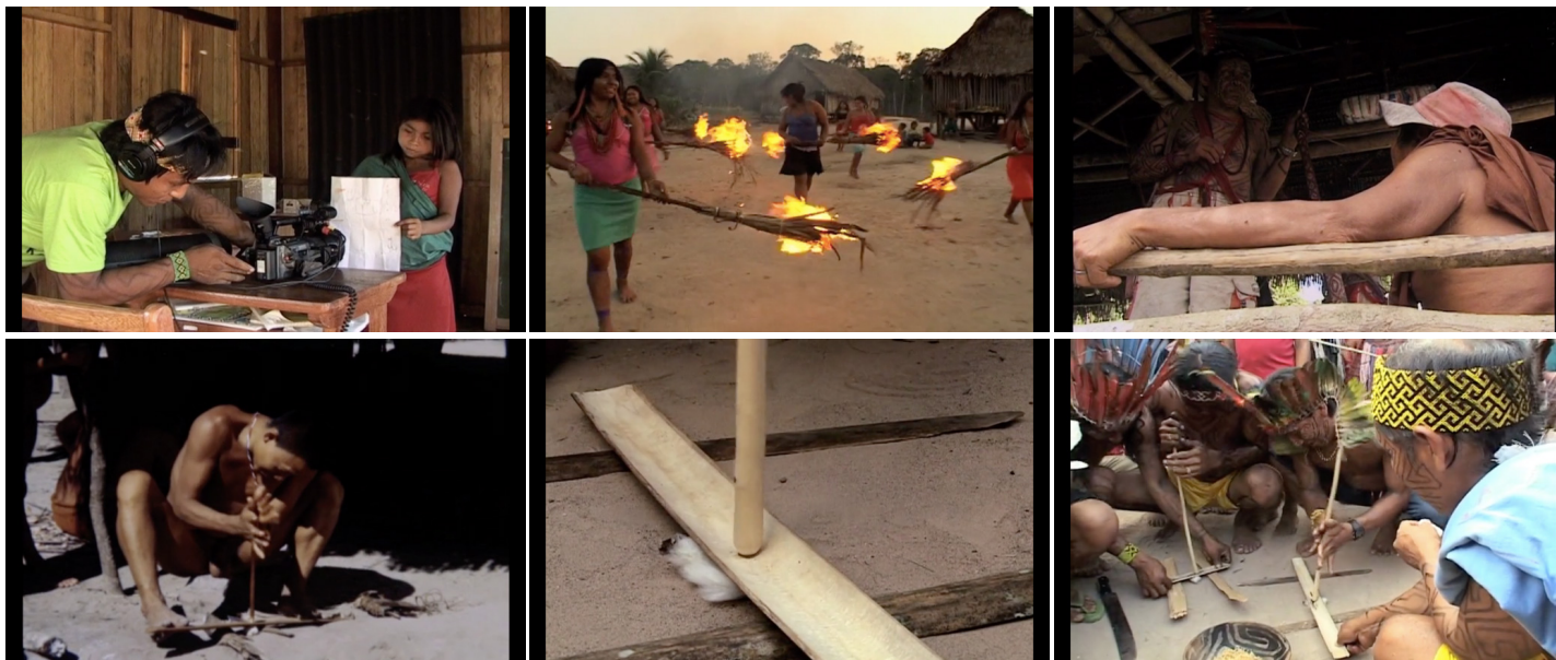
Painel 2. Frames de Já me transformei em imagem .