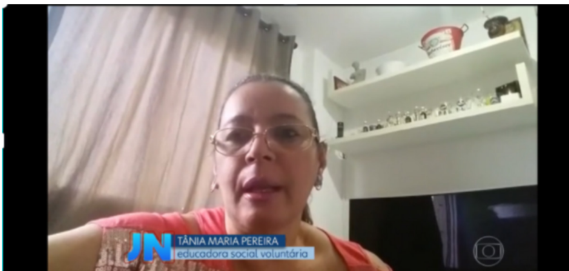
Figura 2. Fonte grava depoimento do seu local de moradia com o braço esticado, indicando a operação do dispositivo móvel que ela mesma controla.