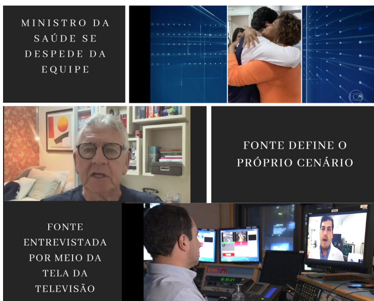
Figura 1. Montagem ilustra inserções de imagens com o uso de dispositivos móveis e do distanciamento físico entre fonte e reportagem.

evidente a escassez de imagens narrativas nas reportagens. Só no primeiro bloco, o ex-ministro da Saúde Henrique Mandetta aparece se despedindo da equipe em imagens verticais de smartphone com barras nas laterais, uma fonte especialista da área agrícola aparece em cenário residencial e a entrevista entre o repórter e a fonte é mediada pelas tecnologias móveis, como mostra a ilustração em composição de telas (figura 1).