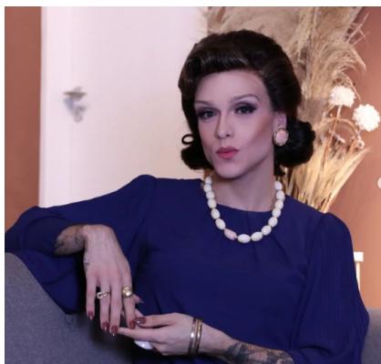
Figura 1. Rita Von Hunty (postagem do Instagram).

ligados. Essa familiaridade com a linguagem, com a corporeidade, e com itens desse universo permite uma entrada maior das drag queens no campo midiático (CUNHA FILHO, 2023, p. 19).