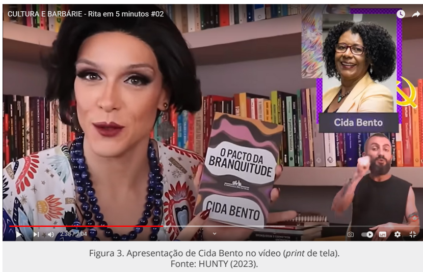
Figura 3. Apresentação de Cida Bento no vídeo (print de tela).

Lembramos agora de outro exemplo de iniciativa progressista com forte apoio sobre as imagens nas plataformas digitais. Trata-se de Erika Hilton. Negra e trans, ela foi eleita vereadora na cidade de São Paulo pelo Partido Socialismo e Liberdade (PSOL) em 2020. Entre as pautas defendidas por ela estão a defesa dos Direitos Humanos, equidade racial, combate à discriminação contra a comunidade LGBTQIA+ e valorização das culturais jovens e periféricas. Em 2022, foi eleita deputada federal por São Paulo com 256 mil votos (BRAZ, 2022), o que lhe rendeu a nona maior votação no estado.