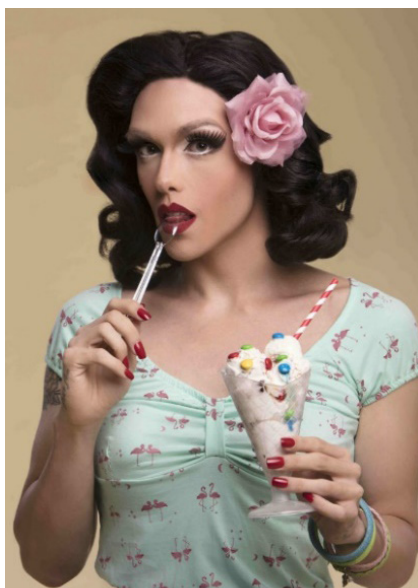
Figura 2. Foto de ensaio para a marca Bruna Pepper.