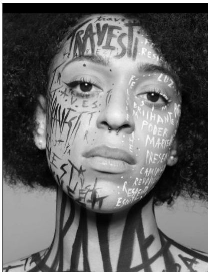
Figura 4. Foto para o projeto Feito Tatuagem .