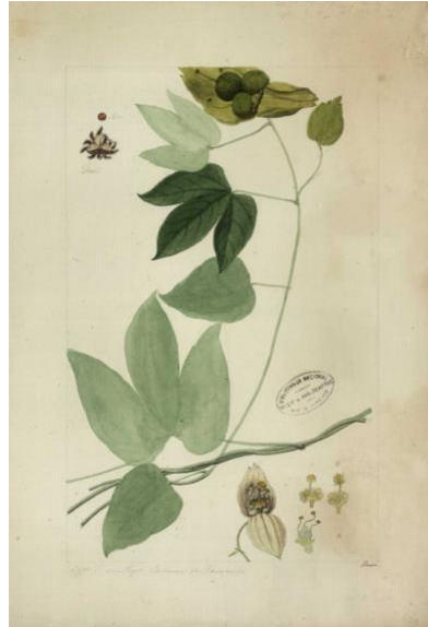
Figura 2: Ilustração de uma planta, do gênero Dolechampia . Desenho em aquarela pertencente ao espólio da Viagem Filosófica de Alexandre Rodrigues Ferreira (1783-1792). Dimensões: imagem 26,5x17,0cm em papel 34,5x24,0cm. 44