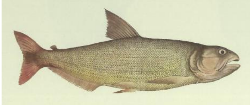
Figura 7: Ilustração de um peixe da fauna brasileira identificado como “Dourado”. Desenho em aquarela pertencente ao espólio da Viagem Filosófica de Alexandre Rodrigues Ferreira (1783-1792) 81