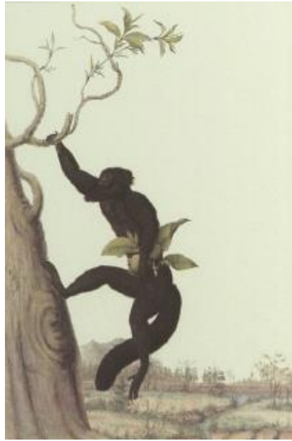
Figura 6: Ilustração de um mamífero da fauna brasileira identificado como “Cuxiu-preto”. Desenho em aquarela pertencente ao espólio da Viagem Filosófica de Alexandre Rodrigues Ferreira (1783-1792) 70