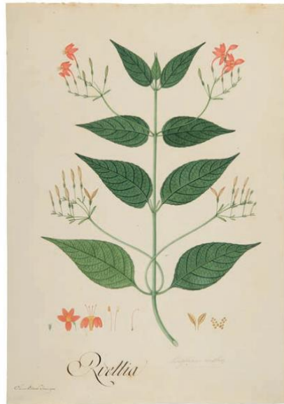
Figura 3: Ilustração botânica, do espécime Ruellia ischnopoda . Sem data, têmpera no papel. Dimensões: 54 x 37.5 cm 53