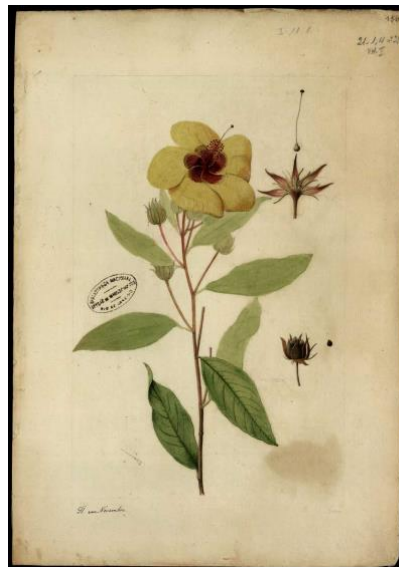
Figura 4: Ilustração de planta, do gênero Hibiscus . Desenho aquarelado sobre papel pertencente ao espólio da Viagem Filosófica de Alexandre Rodrigues Ferreira (1783-1792). Dimensões: 27,0 x 17,0 cm. 54

A descrição da natureza deveria ser: textual e visual; breve e objetiva; individualizar os espécimes; e estar vinculadas aos interesses coloniais e científicos. As ilustrações científicas produzidas no contexto das “Viagens Filosóficas” buscavam retratar todos os detalhes do espécime de forma naturalística, devendo ser riscados todos os detalhes com o máximo de precisão possível. Além disso, os artistas da expedição tinham a função de ensinar o desenho e a pintura aos demais membros, para caso fosse preciso substituir os desenhadores 55 .