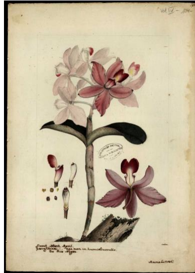
Figura 5: Ilustração de uma planta da flora brasileira (gênero Orchidea ). Desenho em aquarela pertencente ao espólio da Viagem Filosófica de Alexandre Rodrigues Ferreira (1783-1792). Dimensões: imagem 26,5x17,0cm em papel 66

Algumas imagens apresentavam divergências em relação ao conjunto mais amplo de ilustrações botânicas, não retratando, por exemplo, os componentes das flores (forma, posição, tamanho e distribuição no espaço), impossibilitando, assim, a classificação da espécie pelo sistema linneano. Contudo, subentende-se que se tratava, nesses casos, de espécies já conhecidas, ou seja, que já haviam sido identificadas durante a viagem, portanto, a representação minuciosa do sistema sexual da planta não era necessária. Mas, em outros desenhos de plantas da “Viagem Filosófica”, o sistema sexual foi minuciosamente representado em tamanho natural 67 .