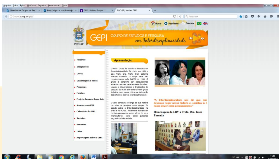
Figura 3: Página inicial da homepage do GEPI site: http://pucsp.br/gepi

Brasil e fora dele interessadas em dialogarem conosco sobre a interdisciplinaridade, além de ser uma fonte dinâmica das informações mais atualizadas sobre a produção no campo da Interdisciplinaridade.