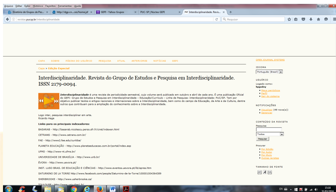
Figura 4: Página portal revista eletrônica PUCSP http://revistas.pucsp.br/interdisciplinaridade

Este trabalho de pesquisa é constante e contínuo e necessita da vivência de um dos principais princípios da Interdisciplinaridade: a ação.