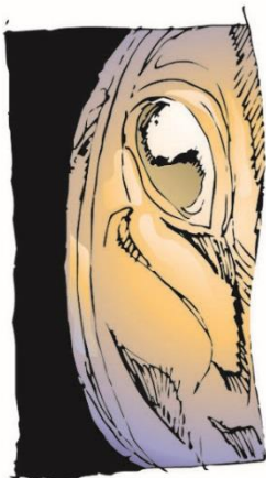
...mas para que correm os homens...?