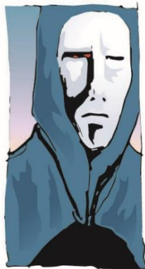
...perto dos homens...