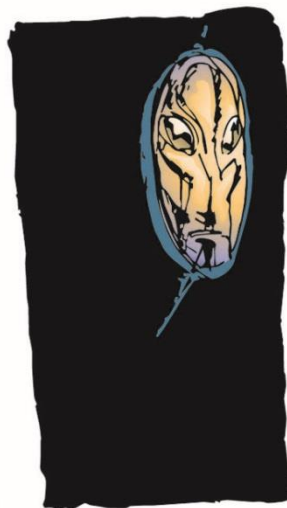
Não é a vida