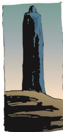
...eu estou longe...