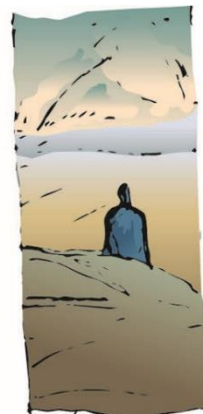
...longe de qualquer lugar...