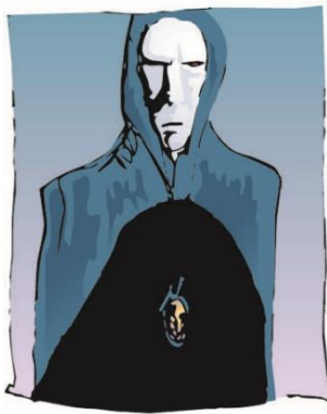
Eu caminho silencioso...