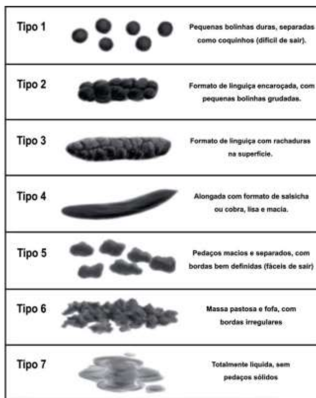
Figura 1 – Escala de Bristol de classificação da consistência das fezes

Por fim, dados adicionais foram registrados pelos pesquisadores em um Diário de Campo, onde os pesquisadores anotaram dados referentes ao constrangimento das entrevistadas frente aos questionamentos e situações relatadas por estas em relação aos fatores psicossociais e à qualidade de vida.