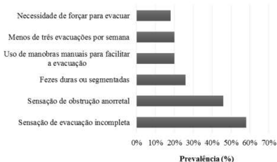
Figura 2 – Prevalência dos critérios entre as idosas constipadas

Em relação ao número de critérios positivos entre aquelas classificadas como constipadas (Figura 3), observa-se que a metade delas apresentava apenas dois, dentre os seis critérios avaliados, e que nenhuma delas apresentou os seis critérios positivos.