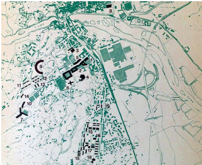
Imagen 3 – Olivetti en Ivrea

Escapa a los objetivos de esta investigación analizar la arquitectura presente en Ivrea, ya ampliamente documentada (Zorzi, 1990). Quizás sea de mayor provecho enfocarse