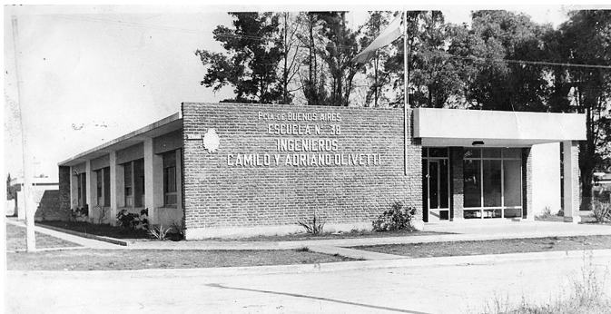
Imagen 7 – Escuela n. 38 Ingenieros Camilo y Adriano Olivetti, Merlo