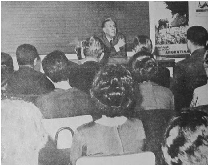
Imagen 9 – Jorge Luis Borges en la Escuela n°38 Ingenieros Camilo y Adriano Olivetti, 7 de abril 1967

Fuente: Borges, J. L. (1967). La literatura fantástica . Buenos Aires, Ediciones Culturales Olivetti.