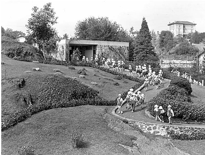
Imagen 4 – Jardín de infantes de Borgo, Ivrea, h1950