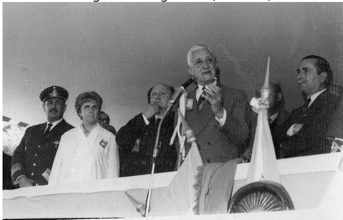
Imagen 8 – El presidente Arturo Umberto Illia en la inauguración de la escuela, junto al gobernador Anselmo Marini (derecha) y el director general de Olivetti Argentina Luigi Borio (al centro)