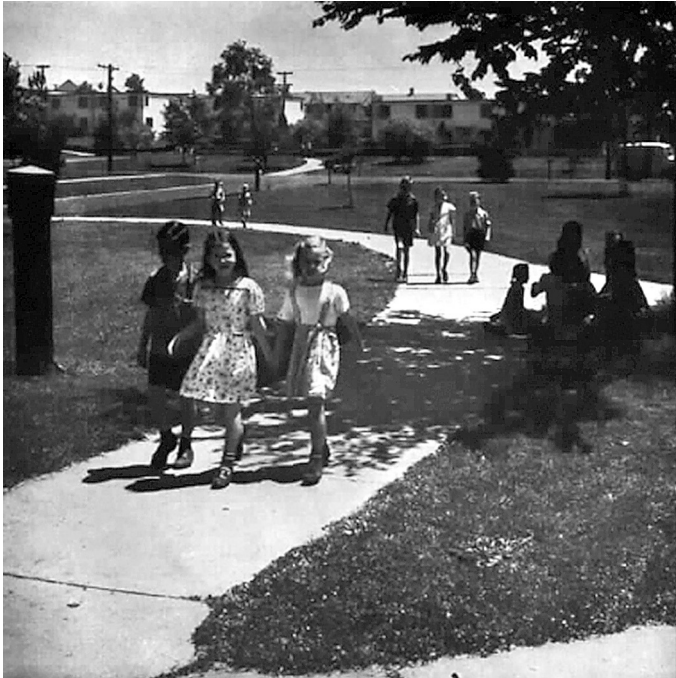
Imagen 1 – Greenbelt Maryland