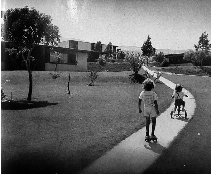
Fuente: BOESIGER, W. (ed.) (c1964). Richard Neutra, 1923-50: buildings and projects . Londres, Thames and Hudson.

en la vastedad del territorio estadounidense consistía en asimilar un equilibrio constante con el ambiente original y el ambiente heredado, una nueva etapa donde se debía dominar lo mecánico y pasar del "despotismo a la asociación simbiótica, del capitalismo y del fascismo a la cooperación y comunismo básico" (Mumford, 1938, p. 383). La región, definida como la "unidad-área formada por condiciones aborígenes comunes de estructura geológica, de suelo, de clima, de vegetación y de vida animal; reformada y en parte nuevamente definida mediante el establecimiento del hombre" (ibid., p. 461), debía ser objeto de una planificación auténtica y particularizada de la agricultura, la industria y la ciudad. Los temas de diversidad y descentralización regional eran ampliamente tratados por Mumford y serían tomados con entusiasmo por Adriano.