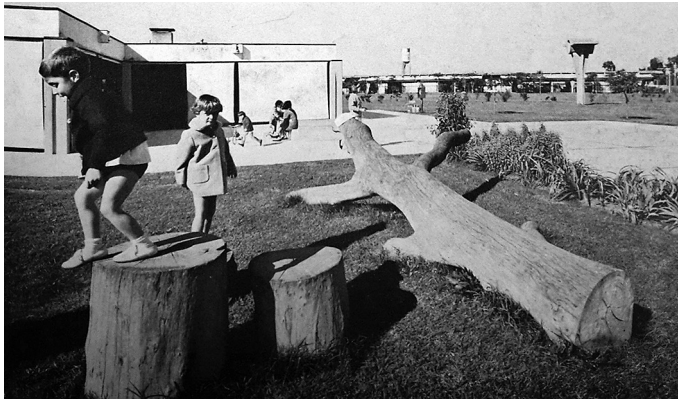
Imagen 6 – Guardería en establecimiento industrial Olivetti, Merlo