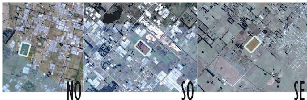
Cuadro 2 – Matriz de análisis: resultados Caso 1