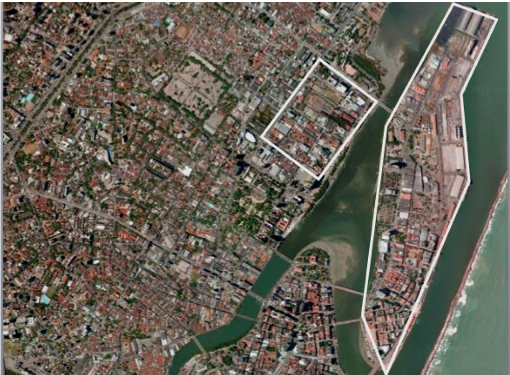
Figura 1 – Bairro do Recife e quadrilátero do Bairro de Santo Amaro

constitui-se inegavelmente em uma operação de requalificação urbana na qual pode-se identificar inspirações no exemplo de Barcelona, retratado por Compans (2001). A área escolhida para a localização do parque tecnológico, o Bairro do Recife, atravessava visível decadência em razão da combinação de longa estagnação da economia pernambucana e desenvolvimento de um novo distrito de negócios ( business district ) no Bairro de Boa Viagem, que impulsionou a emigração de inúmeros estabelecimentos da ilha. O patrimônio histórico e o ambiente construído em geral acompanhavam a desvalorização fundiária imposta pela decadência do antigo business district . Acompanhando