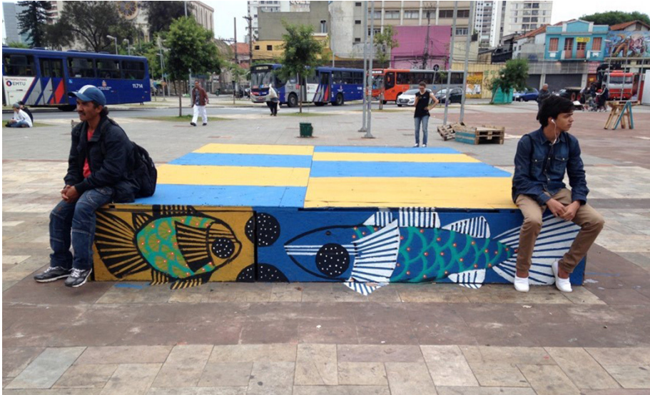
Figura 2 – Mobiliário autoconstruído por Batatas Construtoras e grafite por Angerami