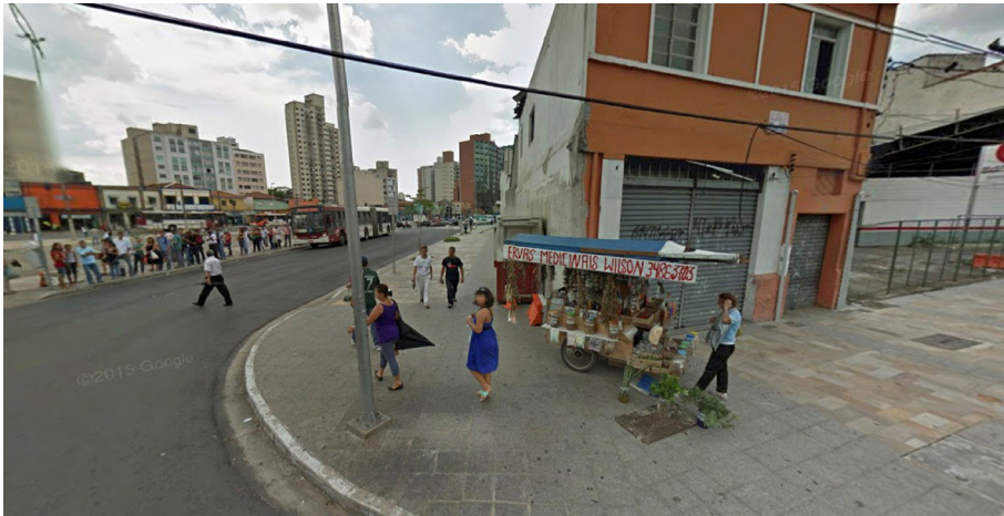
Figura 4 – Processo de transformação no entorno do Largo da Batata