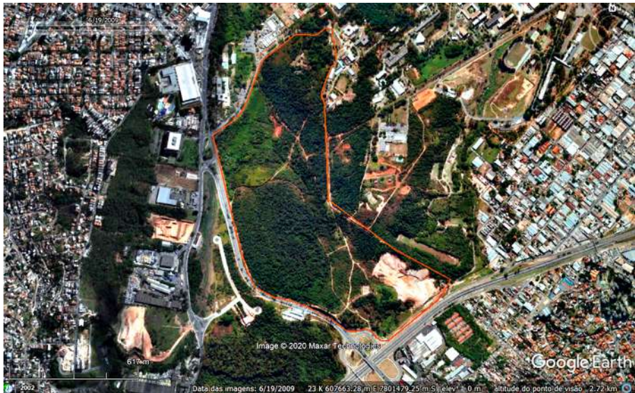
Figura 1 – Estação Ecológica da Universidade Federal de Minas Gerais, Belo Horizonte, MG

Imagem aérea, altitude do ponto de visão = 3,94 km. Limite da E.E. – UFMG. Perímetro 4,36 km e área 0,79 km 2 .