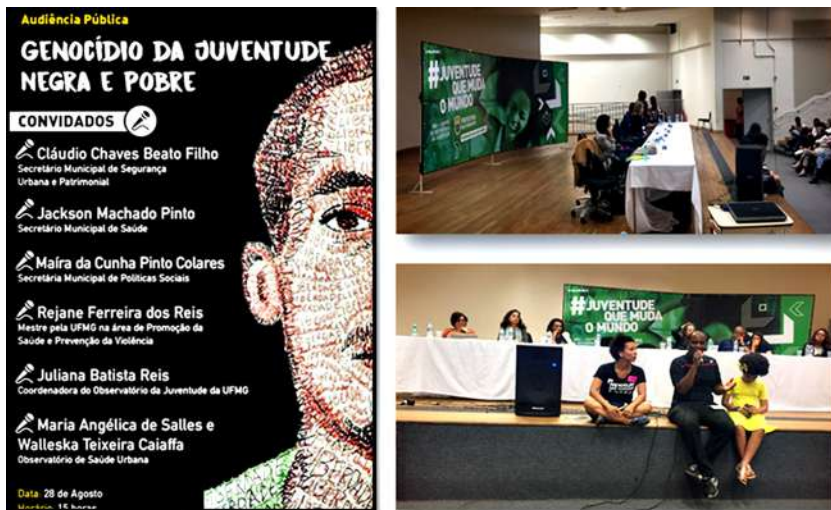
Figura 7 – Escuta pública no Centro de Referência da Juventude de BH em 28/8/2017

Fonte: Arquivo da Disciplina, 2015 a 2020. Imagens montadas para a disciplina.