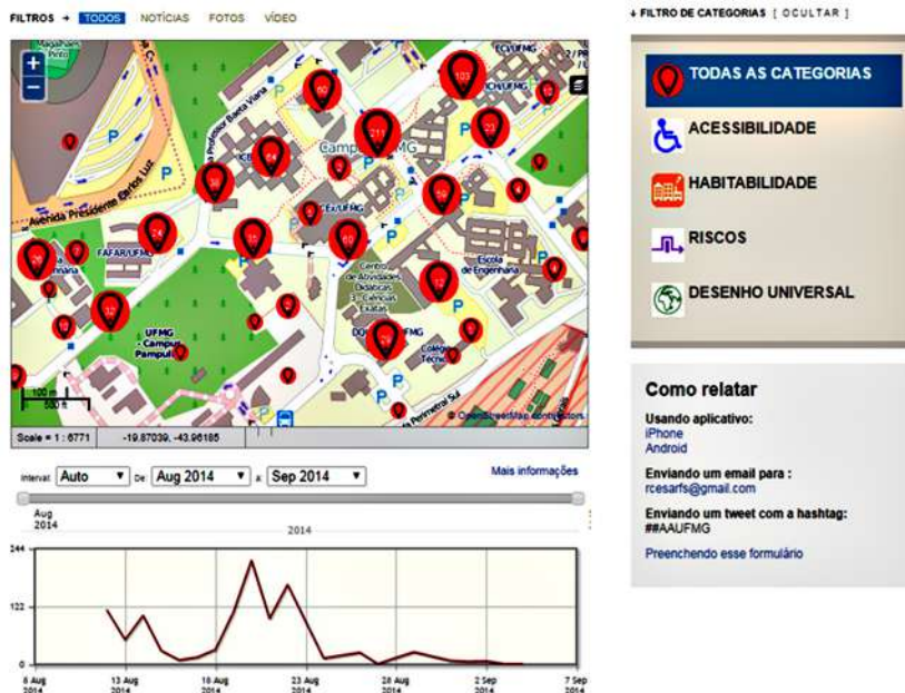
Figura 3 – Interface de ferramentas na área de trabalho para avaliação ambiental

Imagens montadas para a disciplina.