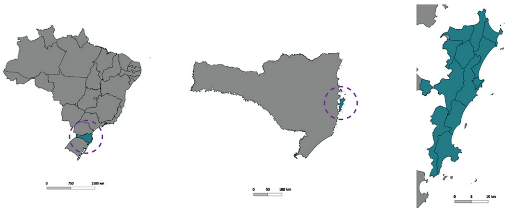
Figura 1 – Localização de Florianópolis