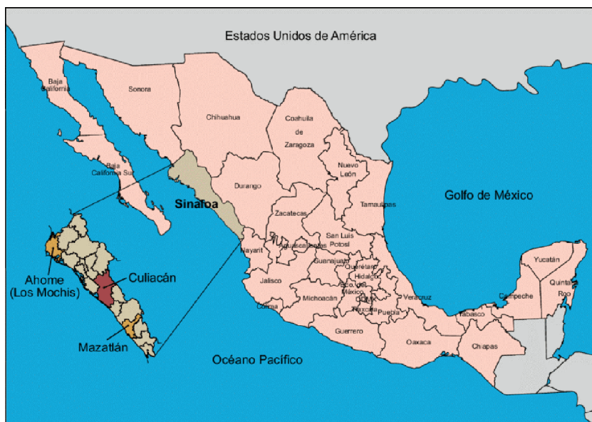
Figura 1 – Localização geográfica de Culiacán