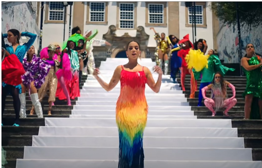
Figura 2: Cena do videoclipe de Me Gusta