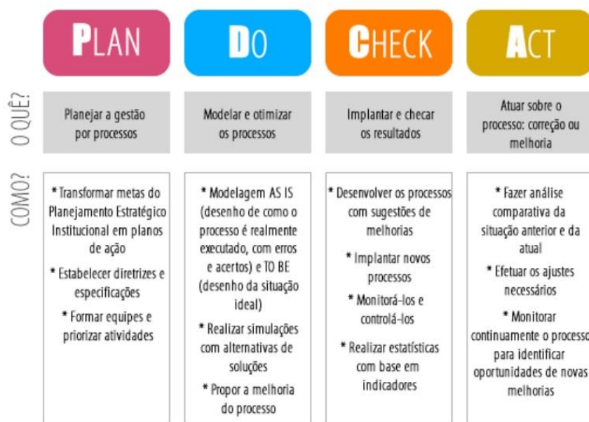
Figura 01 – Ciclo PDCA e as metas para a gestão por processos no MPF