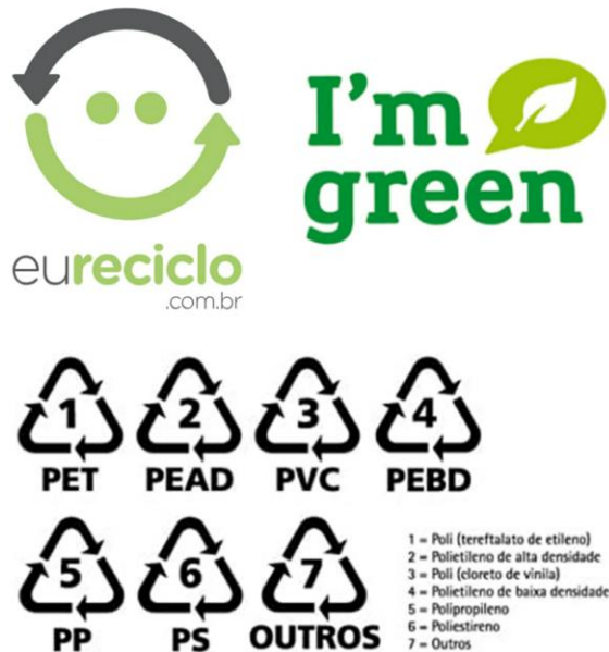
Figura 2 - Selos verdes

(polietileno de baixa densidade). Os porquês de haver headspace 5 , e aplicando em suas peças a inclusão social.