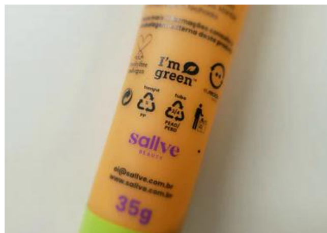
Figura 3 - Presença de selos verdes em produto da marca Sallve