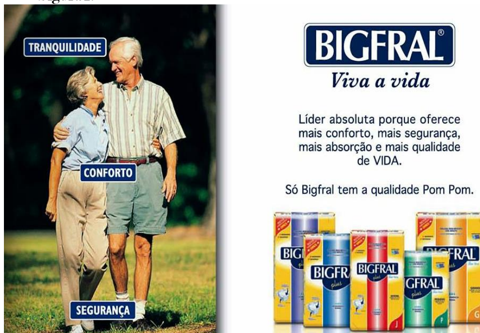
Figura 1: Anúncio Publicitário