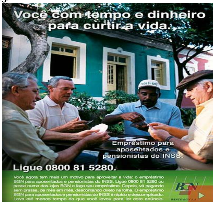
Figura 3: Anúncio Publicitário