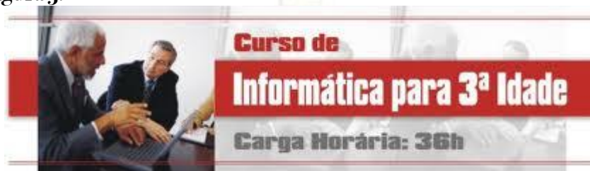
Figura 5: Anúncio Publicitário