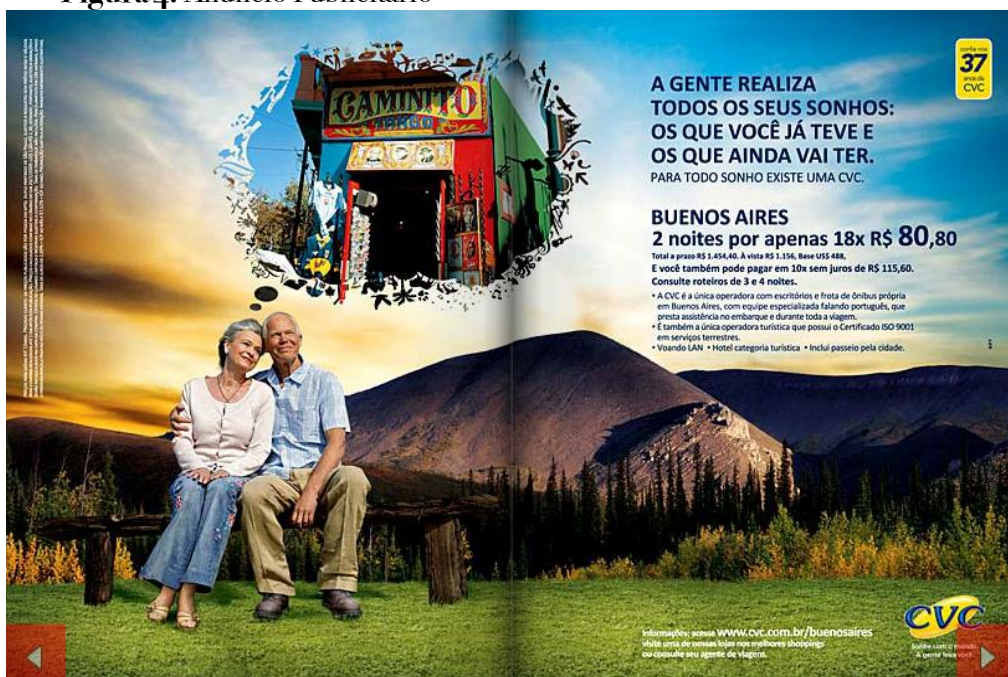
Figura 4: Anúncio Publicitário