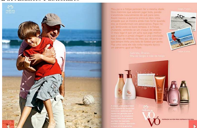
Figura 6: Anúncio Publicitário