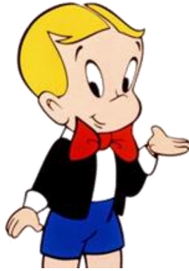
Figura 8 – Richie Rich.