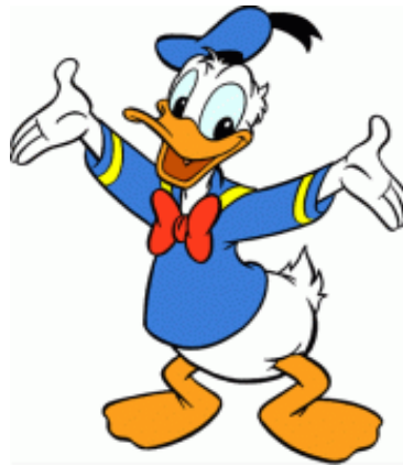
Figura 7 – Pato Donald. Fonte: Walt Disney (1934).

A metáfora "Pato Donald" proferida pelos alunos do curso de Jornalismo ao curso de Administração reproduz funções materiais utilitárias e valores sociais atribuídos ao curso. Nota-se que o personagem foi atribuído de forma pejorativa aos cursos de Economia e Jornalismo.