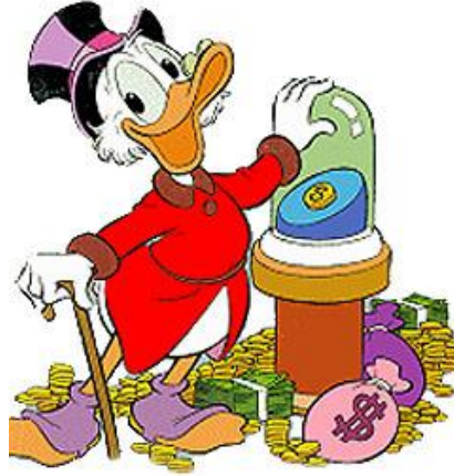
Figura II – Scrooge McDuck .

O personagem Tio Patinhas é referenciado para descrever os alunos do curso de Administração e Economia.