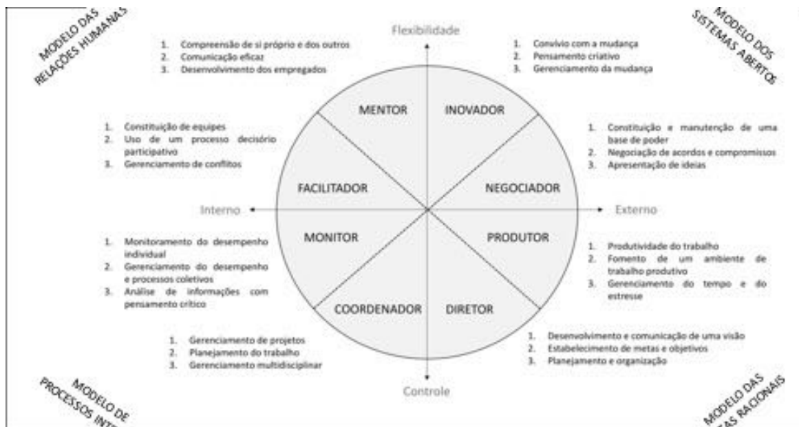
Figura 2 Os papéis e as competências dos líderes

Conforme figura 2 observa-se que os papéis estão dispostos em quadrantes associados a quatro modelos gerenciais propostos por Quinn et al. (2003). O modelo de sistemas abertos possui ênfase na adaptação política, resolução criativa de problemas, inovação e gerenciamento da mudança; o modelo das metas racionais enfatiza a explicitação de metas, análise racional e tomada de iniciativas; o modelo de processos internos possui ênfase na definição de responsabilidade, mensuração e documentação; e o modelo das relações humanas enfatiza a participação, resolução de conflitos e criação de consenso.