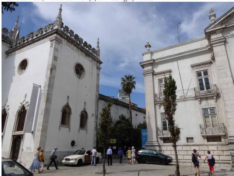
4 de outubro de 2014.