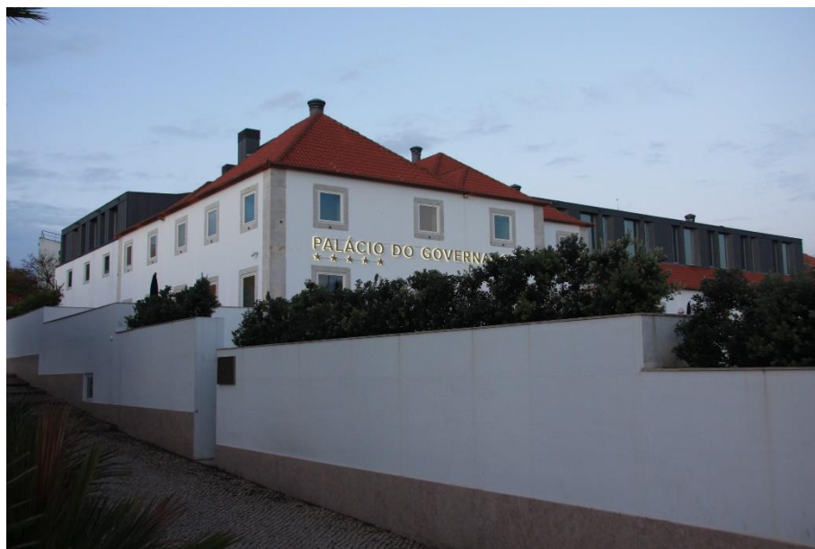
Figura 1: Vista Sul do Palácio Casa do Governador da Torre de Belém, atualmente Hotel Palácio do Governador , em Belém, Lisboa.

02 de março de 2018.