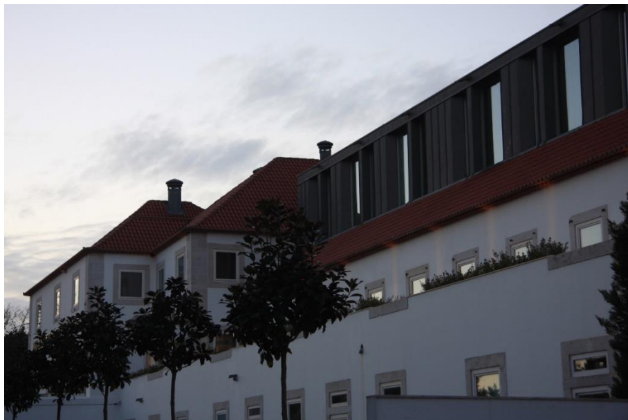
Figura 3: Vista Sul do Palácio Casa do Governador da Torre de Belém, atualmente Hotel Palácio do Governador , em Belém, Lisboa.

Fonte: Fotografia do Arquivo de Nádía Luís, 02 de março de 2018