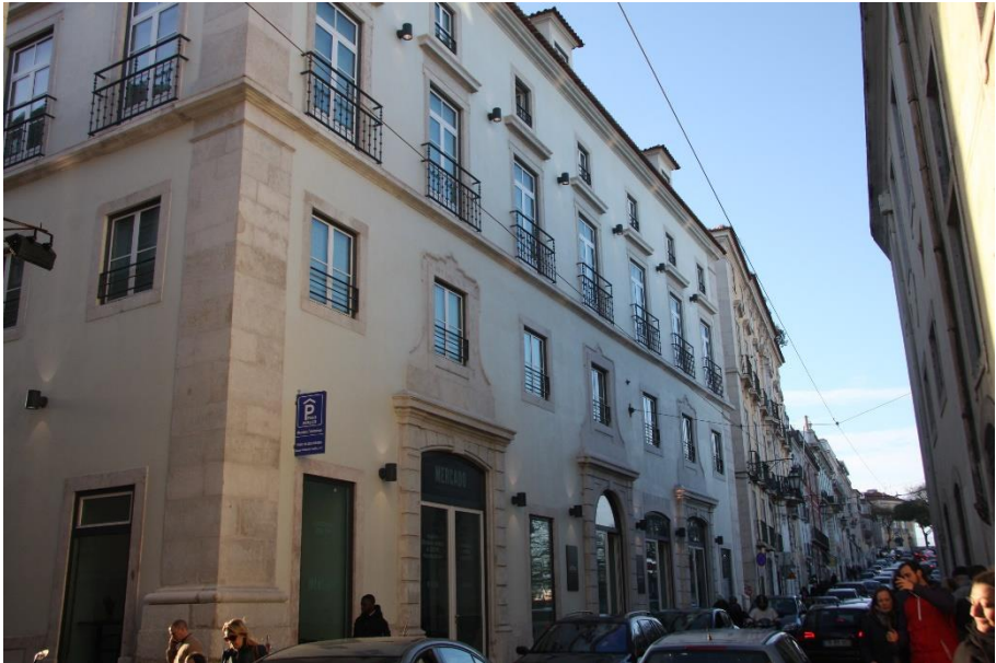
Figura 4: Vista geral do Palácio dos Condes de Lumiares, atualmente The Lumiares Hotel & SPA , no Bairro Alto, em Lisboa.