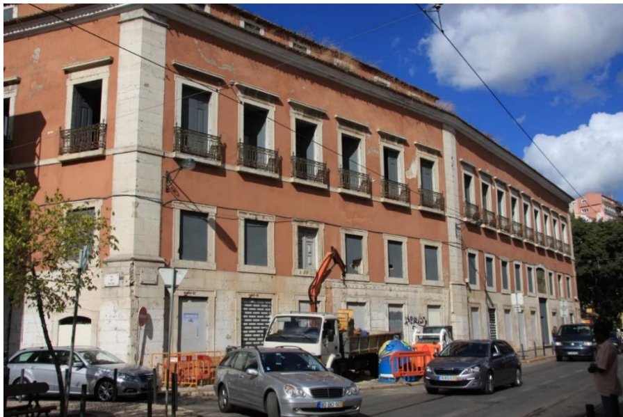
Figura 6: Vista Sul do Palácio Conde-Barão do Alvito, em Santos, Lisboa.